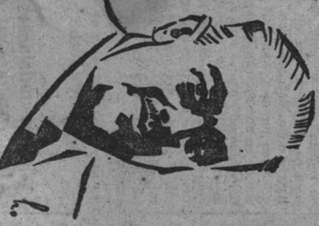
SEÑOR MARTINEZ BARRIO dinamita la cultura de Occidente...