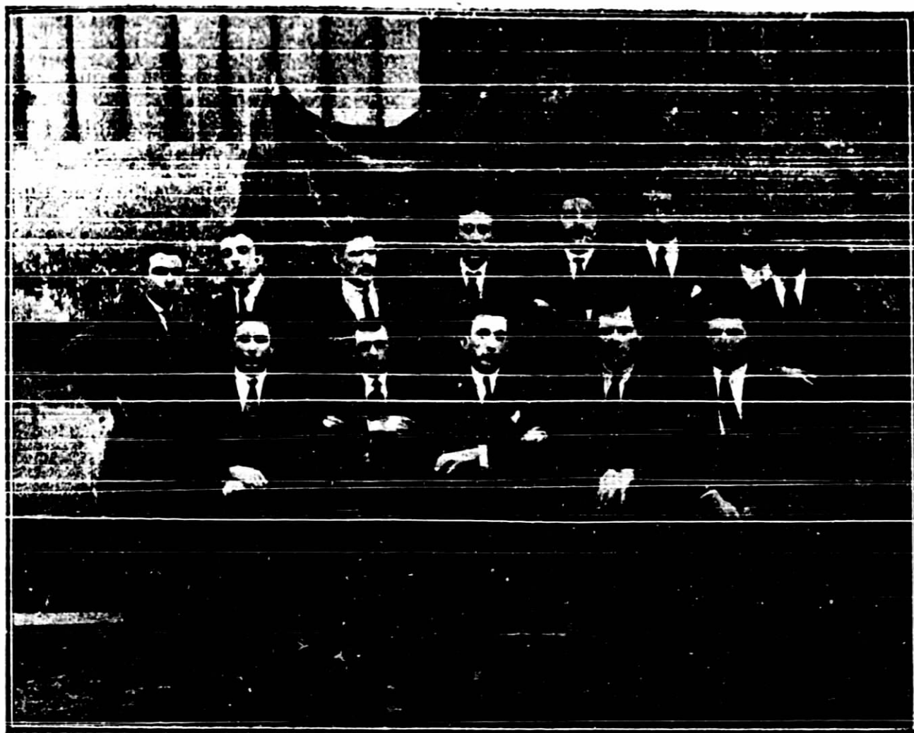
Los delegados que asistieron al primer Congreso de las Juventudes de Galicia

das La Coruña, Ribadeo, El Ferrol, Vigo y Pontevedra. Acordóse adherirse a la Tercera Internacional; ruptura con los partidos burgueses y la constitución de la Federación