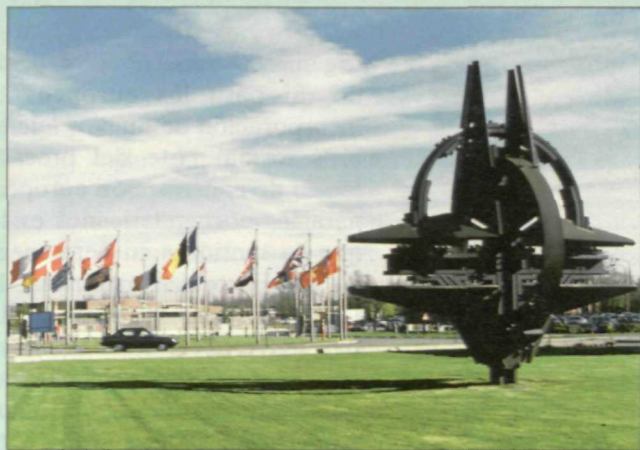
La escultura del símbolo de la Alianza Atlántica da entrada al cuartel general de esta organización en Bruselas (Bélgica)

El inevitable debate nominalista sobre la incorporación de nuevos miembros ha ocultado los aspectos de fondo, el significado real de la ampliación, que sólo puede entenderse en el contexto de la nueva situación de Europa y, por tanto, de los restantes acuerdos con Rusia y otros países. En este sentido, no se trata de mover hacia el Este una defensa avanzada-doctrina abandonada ya por la OTAN en 1991-, sino de proyectar estabilidad hacia el conjunto de Europa, incluyendo a los países que entrarán en el futuro, pero también otros como Rusia o Ucrania que no aspiran a ser miembros de la Alianza. Esta dimensión de respuesta colectiva a los nuevos riesgos es hoy, sin duda, la más importante de la nueva Alianza Atlántica. Para esto objetivos, la OTAN debe mantener una capacidad operativa-