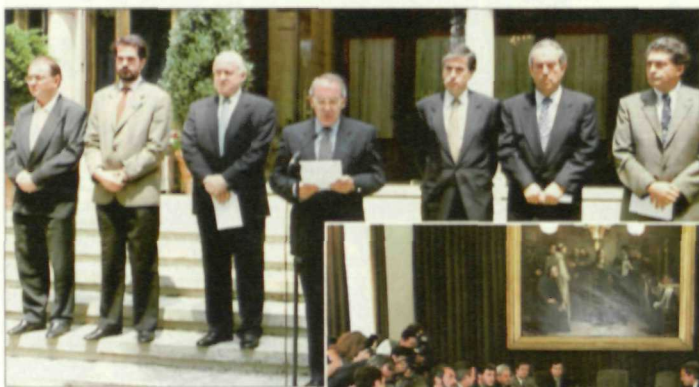
Los partidos políticos democráticos, reunidos en torno a las Mesas de Ajuria Enea, Pamplona y Madrid, han conseguido que el principio de unidad en la lucha antiterrorista se consolide, volviendo a recobrar su espíritu original

natos de Fernando Múgica, Tomás y Valiente, Ordóñez , etc) no es ninguna huida hacia adelante, sino simplemente la aplicación fría y calculada de una estrategia aceptada por mayoría en una Asamblea Nacional de Herri