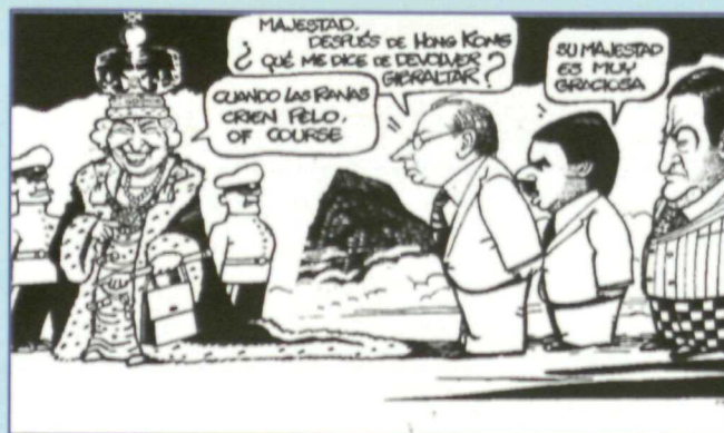
FERRERES ("La Vanguardia")