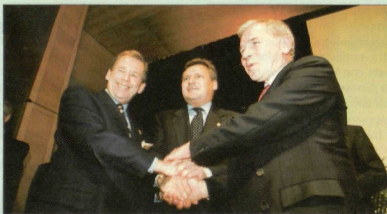
Los Presidentes de la República Checa, Václav Hável , y de Polonia, Aleksander Kwasniewski , junto con el primer ministro de Hungría, Gyula Hórm , celebran su entrada en el club atlántico

comunicaciones, red de alerta y control, etc.- a la que deberán adaptarse los nuevos miembros. La ampliación tendrá, por tanto, unos costes que compartiremos los miembros actuales de la OTAN y los nuevos socios. En el caso de España, aunque el Gobierno ha eludido dar cifras, mi estimación es que se situarán en torno a 20.000 millones de pesetas a lo largo de doce años, doblando así nuestra contribución actual a la OTAN. Como referencia, cuatro meses de operación en Albania cuestan a España 1.675 millones de pesetas. Estas pre-