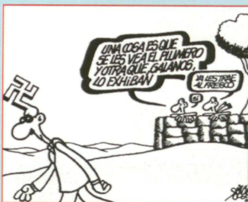
FORGES ("El País")