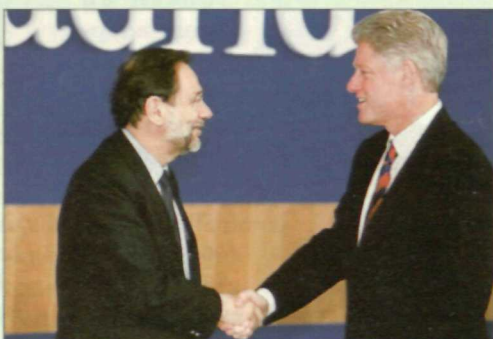
Javier Solana ha recibido la felicitación de los Jefes de Estado y de Gobierno por su destacado papel en la configuración de la nueva Alianza Atlántica

transporte, comunicaciones, etc.- en operaciones bajo la dirección política y el control estratégico de la UEO. En el reciente Consejo Europeo de Amsterdam, donde se adoptaron acuerdos sobre la moneda o el espacio judicial común, los europeos no avanzaron claramente hacia esa Identidad de Seguridad y Defensa. La Cumbre de Madrid ha permitido también constatar esta evidencia. Si Estados Unidos, como gran potencia mundial, tiene una estrategia definida, que revisa constantemente, Europa, que es también una potencia económica y comercial, no ha llegado aún a definir siquiera sus intereses comunes de política exterior y de seguridad, un problema que, desde luego, no se resuelve dando a un europeo el mando Sur de la OTAN.