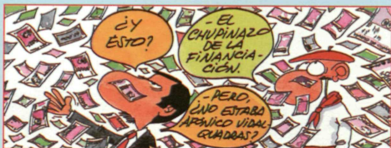
SIR CAMARA