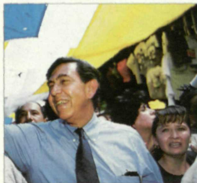
Quahτέρoc Cárdenas ha obtenido un importante triunfo electoral

Por otro lado, la oposición gana espacios y refuerza su legitimidad para participar activamente en el cambio político que habrá de seguir operándose en México. Tanto el conservador Partido de Acción Nacional como, en la izquierda, el Partido de la Revolución Democrática -que ha