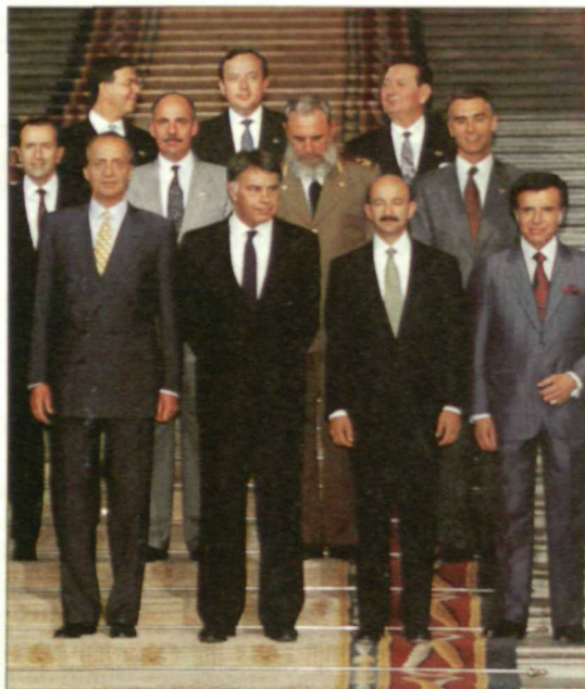
El Rey Juan Carlos y Felipe González, junto a varios Presidentes iberoamericanos.