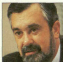
JOSE ANTONIO GRIÑAN Trabajo y Seguridad Social

Como ministro de Sanidad desde 1992, ha demostrado su empeño por racionalizar el uso de los recursos públicos. Vuelve al Ministerio de Trabajo, en el que ya desempeñara tareas de responsabilidad.