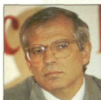
JOSE BORRELL Obras Públicas y Transportes

Después de dejar huella en el mundo sindical, como representante de UGT, se hizo cargo, en 1988, de la cartera de Interior, en la que lleva cinco años dirigiendo la política antiterrorista con grandes éxitos.