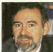
JUAN MANUEL EGUIAGARAY Industria

Después de ser delegado del Gobierno en Murcia y en el País Vasco, llegó al Gobierno en 1991 para hacerse cargo de Administraciones Públicas. Suscribió el pacto autonómico con el PSOE y PP.