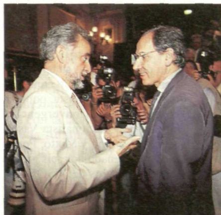
Alfonso Guerra se interesó por la salud de Julio Anguita en su primer encuentro en el Congreso tras las elecciones.

De esta forma, también recalarán en las Cortes, entre otros, los proyectos de Ley sobre la participación institucional de los trabajadores, la del Jurado, la de protección de los derechos de la infancia, la del Servicio Civil y los Estatutos de Autonomía para las ciudades de Ceuta y Melilla.