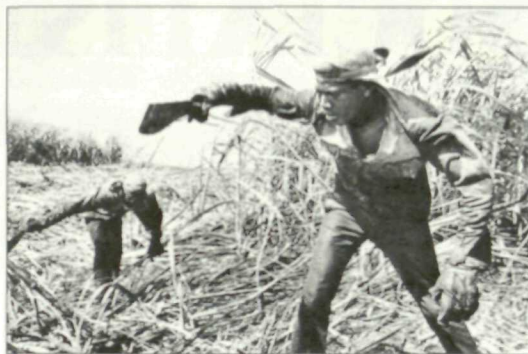
Cortadores de caña de azúcar en Cuba.

«Trabajadores» resume seis años de trabajo y se extiende por parajes tan diversos como las minas de Brasil, los desguaces de barcos de Bangladesh, pasando también por la recogida de té en África o la extracción de petróleo en Ucrania.