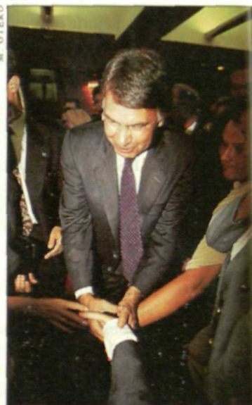
Felipe González, que intervino en el acto con Ramón Rubial, recibió numerosas pruebas de afecto de militantes y simpatizantes.

Varios centenares de militantes socialistas, junto a buena parte de la dirección del PSOE, miembros del Gobierno previo a la formación del nuevo Ejecutivo y parlamentarios, se reunieron a finales de junio en un hotel madrileño para festejar la victoria socialista en las pasadas elecciones generales.