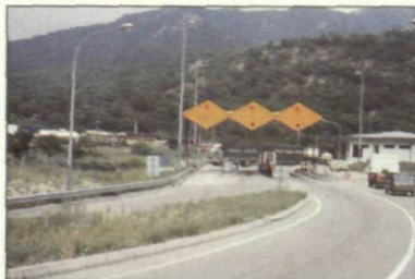
En diciembre, los ciudadanos pertenecientes al grupo Schengen no tendrán que presentar su pasaporte al pasar las fronteras.

El acuerdo ha supuesto un indudable éxito de la diplomacia española —nuestro país ha ejercido la presidencia del grupo durante el primer semestre de este año— en la consecución de la unidad efectiva de Europa. En este sentido, el secretario de Estado para las Comunidades Europeas, Carlos Westendorp , ha reconocido que era un contrasentido que no se estuviera cumpliendo el objetivo de una «Europa de los ciudadanos» cuando, por otro lado, desde el pasado 1 de enero es efectiva la libre circulación de mercancías, valores y divisas en la CE.