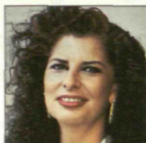
CARMEN ALBORCH Cultura

Elegido para dirigir la nueva cartera que englobará las funciones de Relaciones con las Cortes y portavoz del Gobierno, viene del Ministerio de Educación después de haber trabajado intensamente en la reforma educativa.