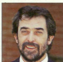
JUAN ALBERTO BELLOCH Justicia

Fundador de la Asociación Jueces para la Democracia, este turolense, de familia catalana y amante del País Vasco, se ha significado en la representación del ala más progresista del Consejo General del Poder Judicial.