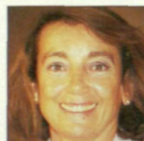
CRISTINA ALBERDI Asuntos Sociales

Una de las pioneras del feminismo en la España franquista, Cristina Alberdi fue la primera mujer nombrada vocal del Consejo General del Poder Judicial y asesoró en la elaboración de leyes como la del divorcio.