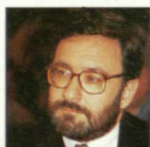
NARCÍS SERRA Vicepresidente

Desde la Alcaldía de Barcelona, llegó al Gobierno en 1982, para dirigir el Ministerio de Defensa. En 1991 pasa a la vicepresidencia del Ejecutivo, en la que sigue, asumiendo ahora competencias económicas.