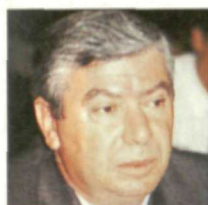
JOSE LUIS CORCUERA Interior

Después de dejar huella en el mundo sindical, como representante de UGT, se hizo cargo, en 1988, de la cartera de Interior, en la que lleva cinco años dirigiendo la política antiterrorista con grandes éxitos.