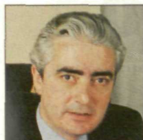
GUSTAVO SUAREZ PERTIERRA Educación y Ciencia

Habiendo ocupado la Secretaría de Estado de Hacienda entre 1984 y 1991, lleva dos años demostrando el buen uso de los presupuestos en obras públicas y su meta es desarrollar el Plan Director de Infraestructuras.