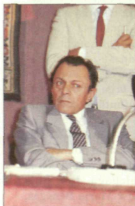
Michel Rocard ha consolidado su liderazgo al frente del Partido Socialista francés.

La ciudad francesa de Lyon acogió la celebración, a primeros de julio, de los Estados Generales del Partido Socialista francés (PS), en lo que ha constituido el primer paso en el "renacimiento" de esta formación política, tras los resultados de las últimas elecciones legislativas llevadas a cabo en el país vecino.