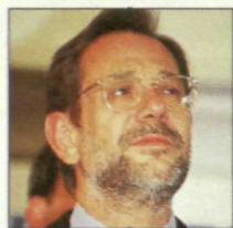
JAVIER SOLANA MADARIAGA Asuntos Exteriores

Desde la Alcaldía de Barcelona, llegó al Gobierno en 1982, para dirigir el Ministerio de Defensa. En 1991 pasa a la vicepresidencia del Ejecutivo, en la que sigue, asumiendo ahora competencias económicas.