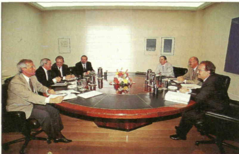
Las delegaciones del PSOE y PNV durante las conversaciones sobre los pactos de gobierno.

sarias para el desarrollo de nuestra economía y nuestra sociedad.