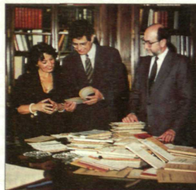
La directora de la Biblioteca Nacional recibiendo el material donado por la Fundación Pablo Iglesias.

La entrega de estos impresos, que se inscribe en las relaciones de co-