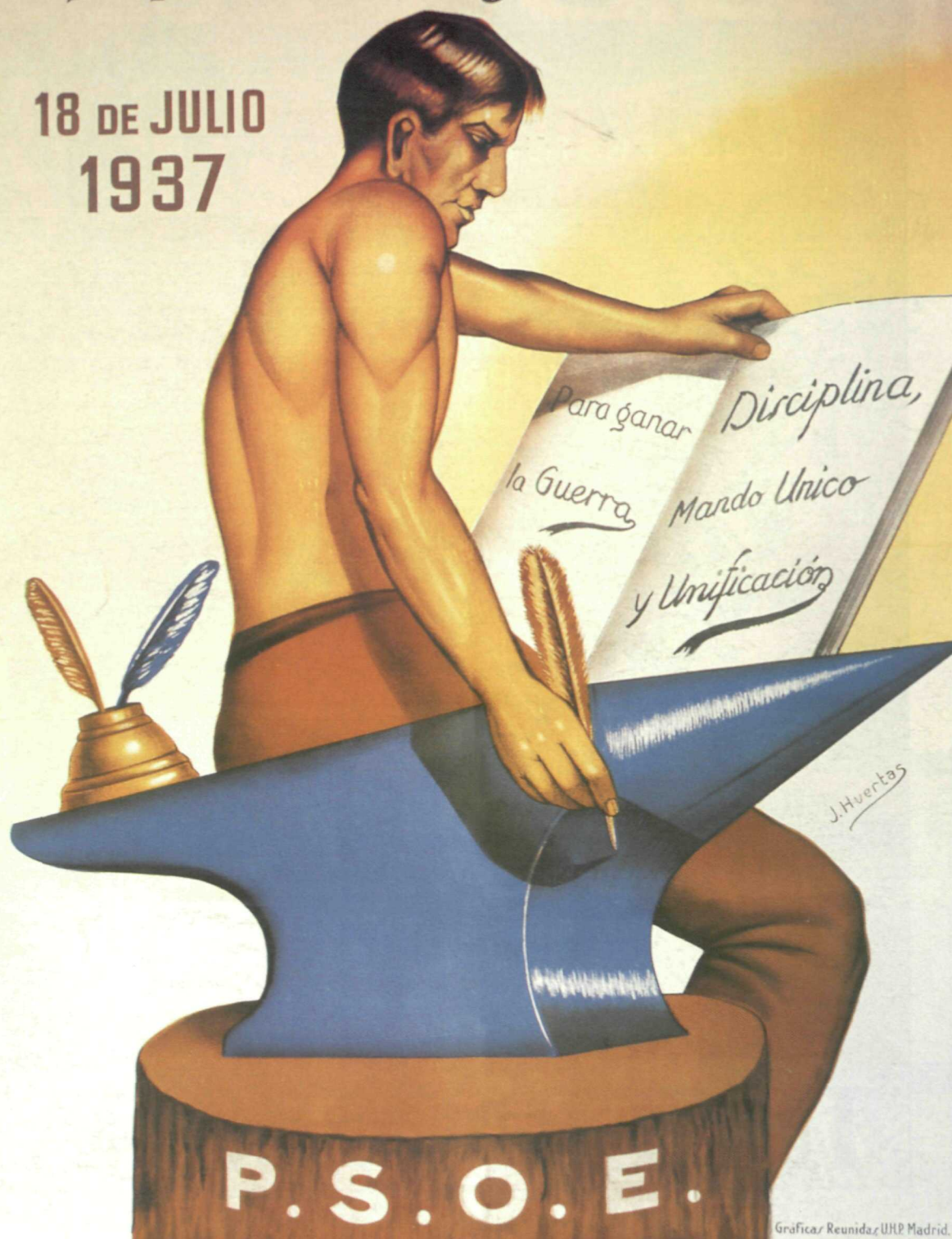
CARTEL DE LA AGRUPACION SOCIALISTA MADRILEÑA, 1937