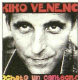
Kiko Veneno mira y canta a la vida