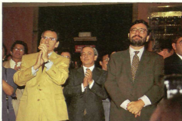
Distintos miembros de la dirección del PSOE y del Gobierno se dieron cita en este homenaje a la militancia socialista.