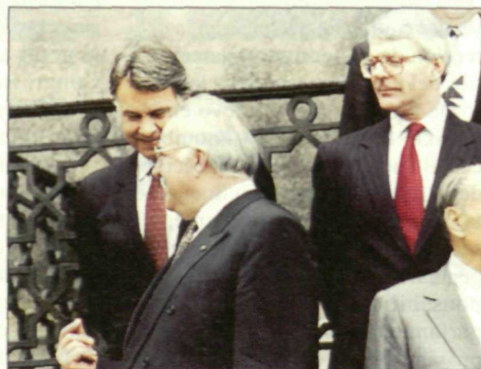
El canciller alemán, Helmut Kohl, conversa con González ante la atenta mirada del «premier» británico, John Major.

En cuanto al Libro Blanco sobre la competitividad, el crecimiento y el desempleo, será el presidente de la Comisión, Jacques Delors , el encargado de su elaboración. Las conclusiones