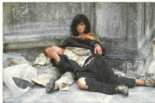
Juliette Binoche y Denis Lavant, insólitos «clochards»

● Se ha puesto a la venta el manual «Ecología cotidiana» donde se repasan los quehaceres cotidianos y sus consecuencias medioambientales. Su precio es de 900 pesetas. Interesados llamar al teléfono: (91) 247 15 06.