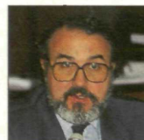
PEDRO SOLBES Economía y Hacienda

Entre 1987 y 1991, dirigiendo la Secretaría de Estado de la CE, pudo poner a prueba sus amplios conocimientos en Asuntos Exteriores. Desde el 91, como ministro de Agricultura, ha demostrado sus dotes de hombre negociador.