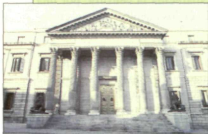
El diálogo entre las fuerzas políticas será un elemento clave de la legislatura recién estrenada.

Es aún muy pronto para vislumbrar qué camino pueden tener estas primeras reuniones. No se sabe aún qué concesiones, qué sacrificios están dispuestos a hacer unos y otros. Pasado el momento de la declaración de buenas intenciones, llegará la hora de pasar al terreno de los hechos. Nada puede, pues, concretarse sobre el alcance que puede tener la aproximación entre el Gobierno y los agentes sociales. Pero el simple hecho de que ya se haya producido, con la intención compartida de "arrimar el hombro", es una magnífica noticia.