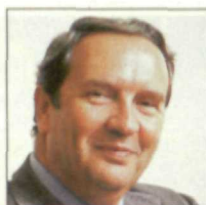
JERONIMO SAAVEDRA Administraciones Públicas

Como secretario de Estado para el Medio Ambiente, es el máximo responsable de la elaboración del Plan Hidrológico Nacional. Antes ya había demostrado su dominio de la materia agrícola al frente de MERCASA y el FORPPA.