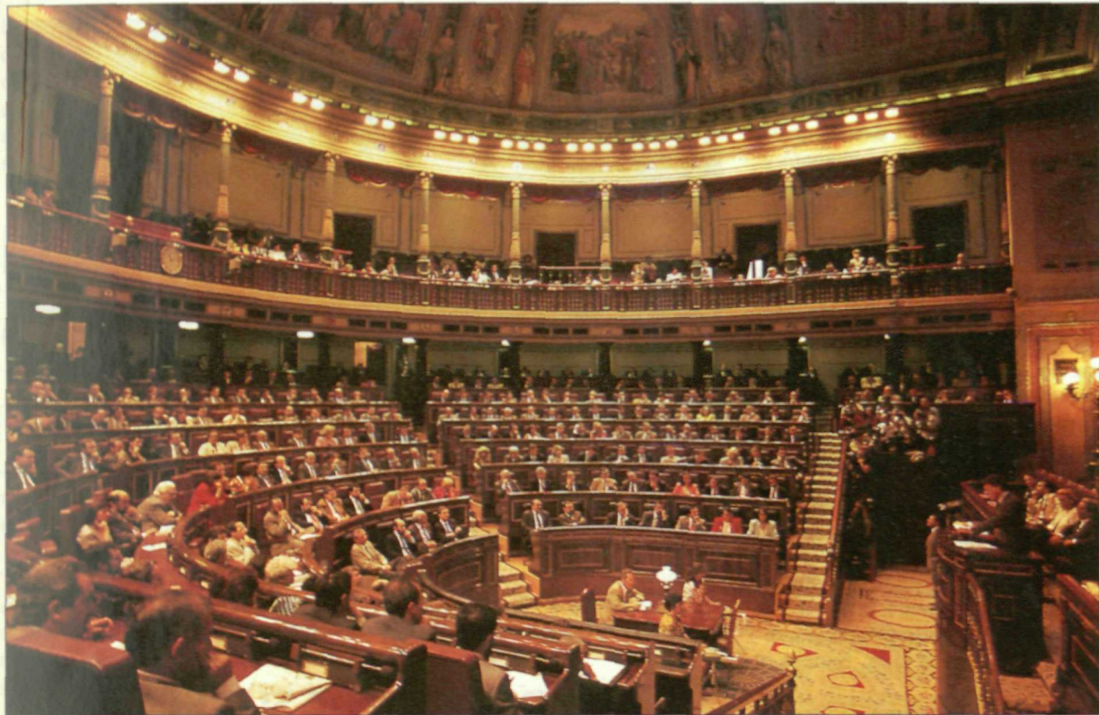
El Parlamento ya ha dado sus primeros pasos en esta nueva legislatura.