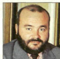
JAVIER GOMEZ-NAVARRO Comercio y Turismo

Gómez-Navarro llega al Gobierno precedido de la fama ganada como responsable del deporte español, como uno de los artífices del éxito de las Olimpiadas de Barcelona y de la reconversión del mundo deportivo.