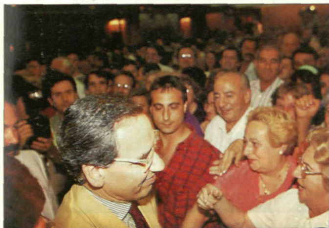
El vicesecretario general de PSOE, Alfonso Guerra, también fue objeto del afecto de los presentes en la fiesta

respuesta al reto que suponían los recientes comicios, el secretario general del PSOE alentó a los militantes socialistas a permanecer atentos y seguir trabajando en los próximos años, afirmando que «esta legislatura nos va a exigir mucha apertura, mucho contacto con los ciudadanos y muchas explicaciones». De acuerdo con esta previsión, González no ocultó que «esta legislatura va a ser difícil», aun cuando aseguró que si mantiene la apertura y la cercanía necesarias al resto de la sociedad, el PSOE estará en «mejores circunstancias dentro de cuatro años, cuando tengamos que hacer otra confrontación electoral».