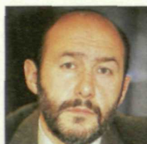
ALFREDO PEREZ RUBALCABA

En el Ministerio al que accede, este miembro de la CEF del PSOE podrá demostrar sus conocimientos en materia autonómica, ganados durante sus distintos períodos al frente de la Junta de Canarias.