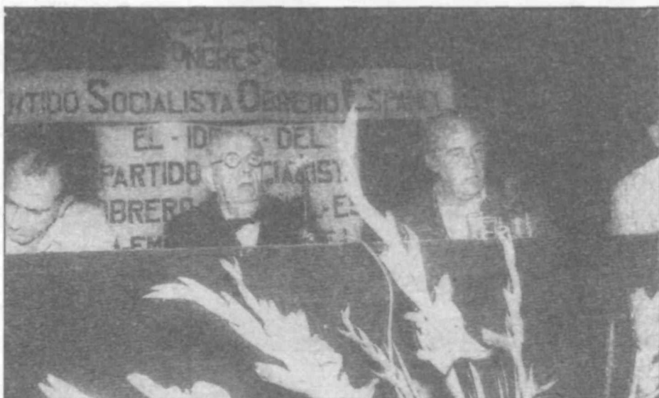
El XI Congreso en el exilio, primero al que asistió Felipe González, fue fundamental en el proceso renovador del PSOE.

bién un capítulo al célebre Congreso de Suresnes, en el que se comenzaron a elaborar los planteamientos políticos, estratégicos y orgánicos nuevos, en consonancia con las aspiraciones de la sociedad española, que permitirían en 1982 el acceso de este centenario partido al Gobierno.