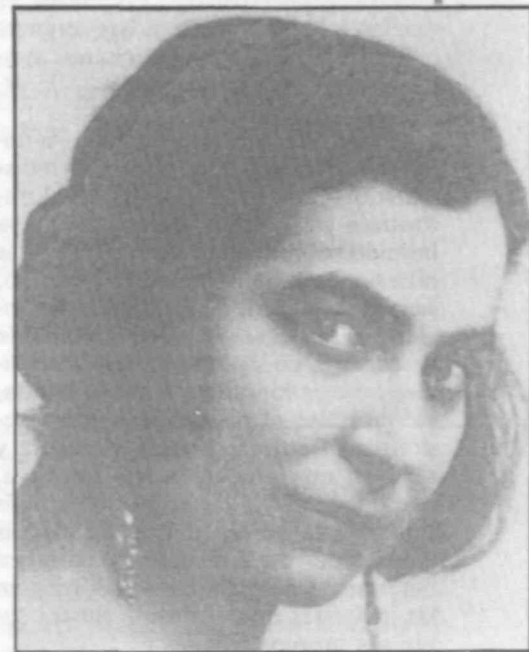
Primer plano de la actriz catalana Margarita Xirgu.

Desde su residencia de Punta Ballena, decía que su regreso a la Ciudad Condal estaba próximo; pero una enfermedad pulmonar le causó la muerte y su decisión se convirtió para siempre en deseo incumplido. Hoy el nombre de Margarita Xirgu tiene un significado honorífico dentro de la cultura hispanoamericana.