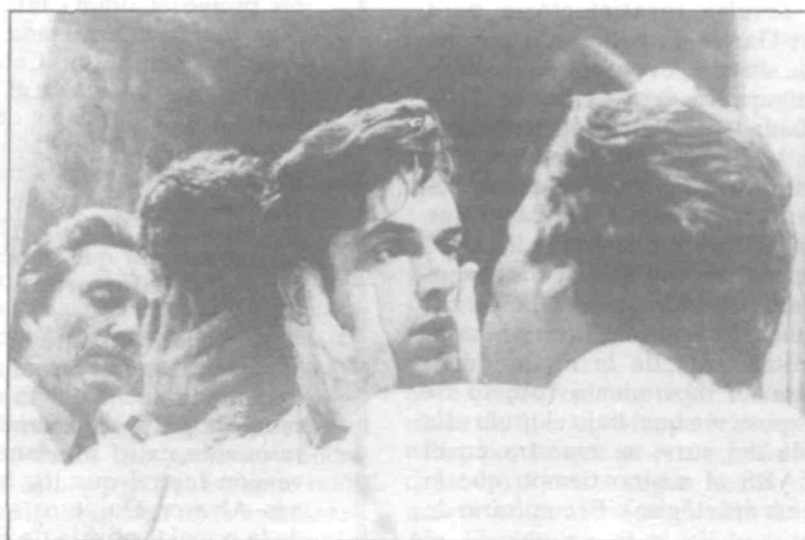
Christopher Walken y Rupert Everett en una secuencia del filme de Schrader.

Hearst (1988), y ahora, El placer de los extraños .