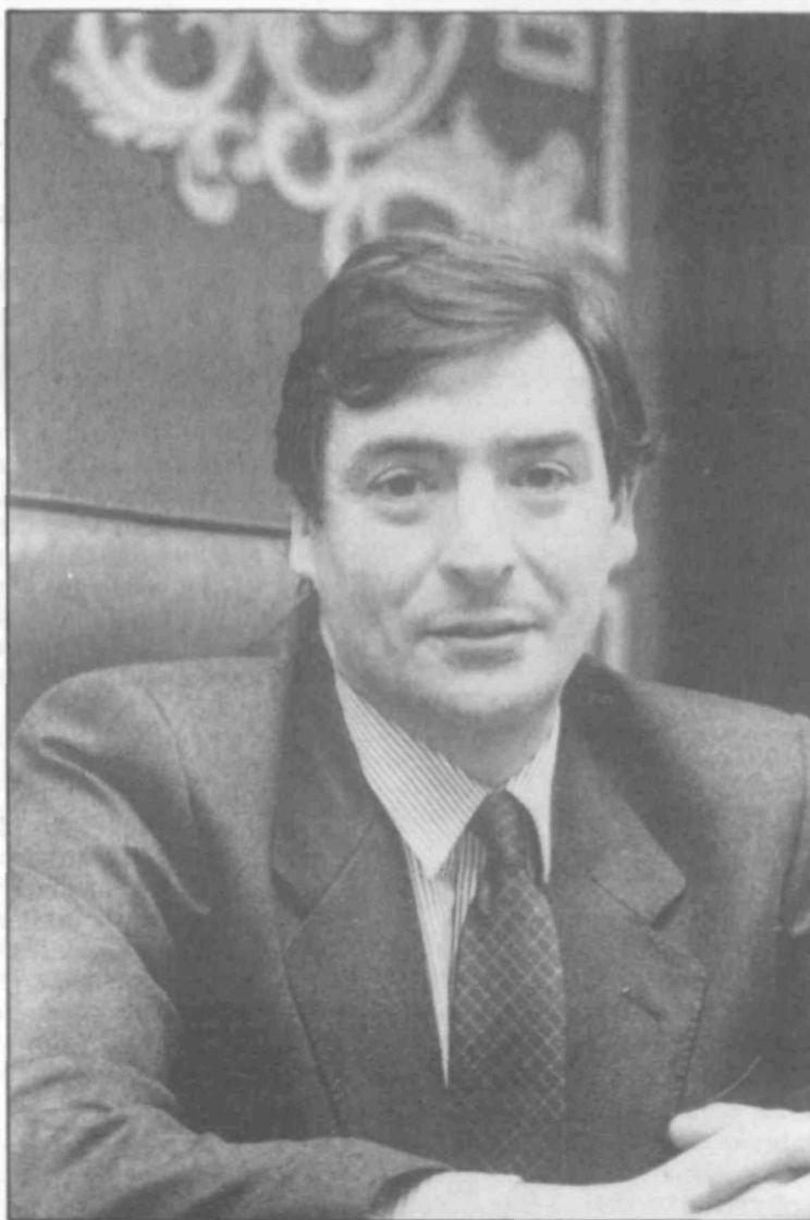
Juan José Laborda, presidente de la Cámara Alta

La consolidación del proceso autonómico en España es una realidad. Pese a ello, los responsables de la política autonómica del Gobierno central y los gestores de las Comunidades Autónomas coinciden en apuntar la necesidad de dar un fuerte y definitivo impulso al Estado de las Autonomías, en base a un gran pacto de todas las fuerzas políticas democráticas. Este impulso no sólo deberá contemplar la ampliación de competencias de una buena parte de las Comunidades Autónomas, las trece que accedieron a su autonomía por la vía del artículo 143 de la Constitución. Habrá de conseguirse también una mayor coordinación entre las autonomías y la Administración central. En este sentido, cobra especial importancia la reforma que en breve se operará en el Reglamento del Senado, para convertir a esta Cámara en instrumento de cooperación entre el Gobierno de la nación y las Comunidades. Como señala Juan José Laborda, presidente del Senado, la reforma de esta Cámara es necesaria para el conjunto del Estado.