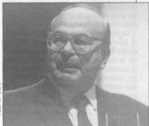
Bettino Craxi, secretario general de los socialistas italianos.

Craxi, que ofrece el balance de una gestión que ha conseguido reformar y fortalecer el PSI, expuso en el congreso que este partido tiene el deber de ser fiel a su empeño de «asegurar la gobernabilidad del país», como ha venido haciendo en estos últimos años. Por ello, aseguró que el PSI seguirá en el Gobierno con los demócratacristianos, aunque su participación no será prestada «a cualquier precio».