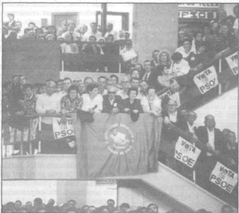
Todas las agrupaciones locales socialistas impartirán estos cursos para facilitar a los nuevos militantes una integración plena en la actividad política del partido.

El curso, a cuyo inicio se entregará a los militantes una Carpeta del Afiliado, con materiales explicativos en torno a la trayectoria del PSOE, el funcionamiento de su organización y las resoluciones congresuales del Manifiesto 2000, se desarrollará a lo largo de tres sesiones.