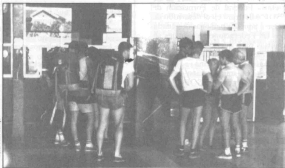
El Ministerio del Interior realizará también una campaña para informar a los turistas sobre cualquier gestión que necesiten hacer.

Por otra parte, el secretario de Estado para la Seguridad, Rafael Vera,