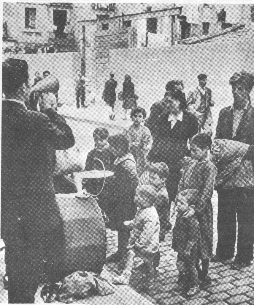
En las calles de Barcelona.... bajo el franquismo.

tribunal que los juzga. En 1949 una nueva redada condujo a la cárcel a más de un centenar de compañeros. Como ejemplo de la represión baste el caso del "Pozo Funeres". En abril de 1948 veintidós vecinos de San Martín del Rey Aurelio, Laviana, Infiesto y municipios Asturianos, colindantes son detenidos al regresar de su trabajo, bajo la acusación de estar fichados como militantes del P.S.O.E. Son torturados y posteriormente arrojados al pozo Funeres en revoltijo vivos y muertos. Para completar la bestial tarea se arroja desde la boca de la cima gasolina que se enciende desde arriba, por los miembros de la brigadilla. No es esta la única fechoría de las tristemente célebres brigadillas especiales de Asturias.