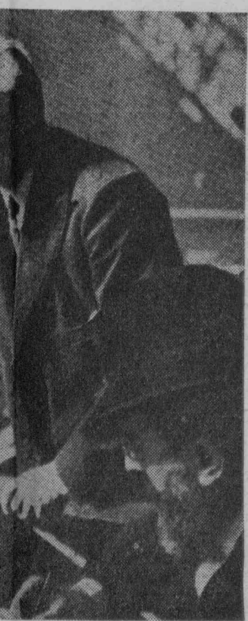
...NCIANDO UN DISCURSO