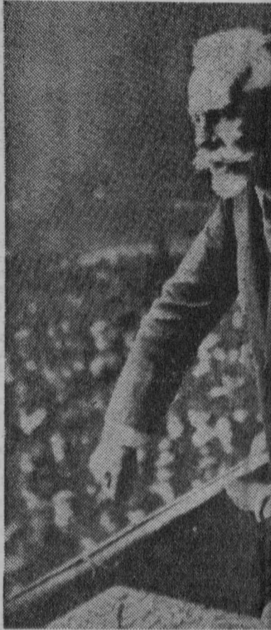
PABLO IGLESIAS PRONUN

El 19, en Santander, el jesuita Angel Herrera Oria, obispo de