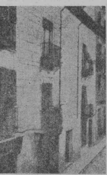
CASA NUMERO 8 DE LA CALLE HERNAN CORTES

La Redacción y Administración estuvo instalada en la calle