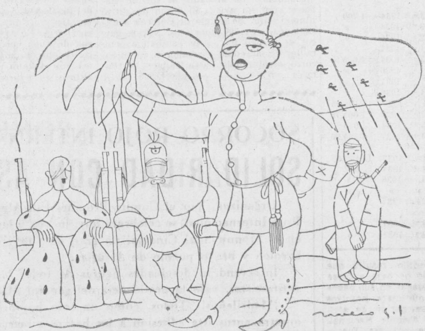
EL NUEVO COLON

Próxima reapertura del Parlamento, la minoría socialista se reunirá el día 29 de septiembre, miércoles, a las diez de la mañana, en el domicilio del Grupo, en Valencia, Gran Vía Durruti, 59, principal (Teléfono 19946). Presencia indispensable.