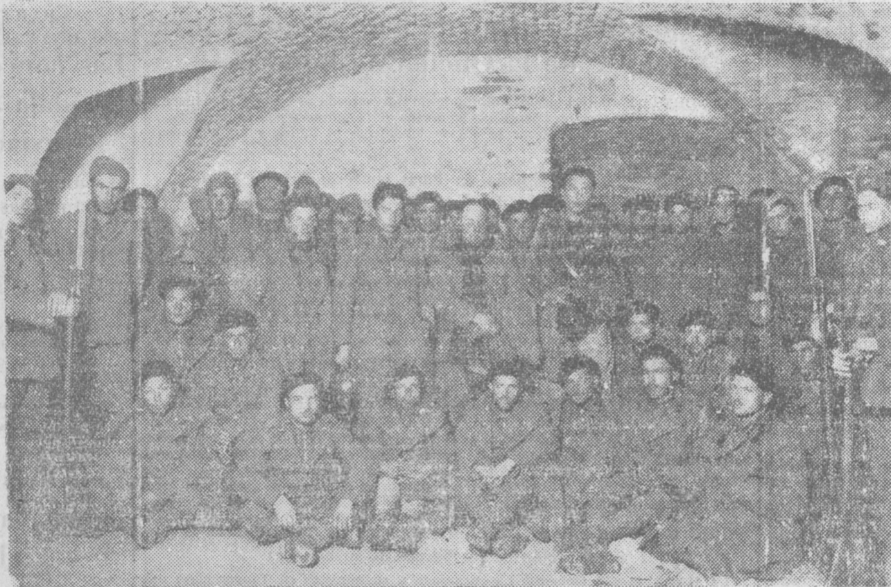
Helos aquí: los que traen al pueblo español el infortunio y la servidumbre. Es un grupo de italianos hecho prisionero en el norte de Guadalajara. Es, por otra parte, un testimonio flagrante de cómo entienden los Estados fascistas la política de «no injerencia».