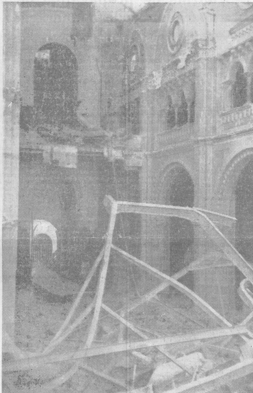
Una iglesia de la calle de Mario Rosso de Luna reducida a escombros por un ataque de la aviación enemiga.