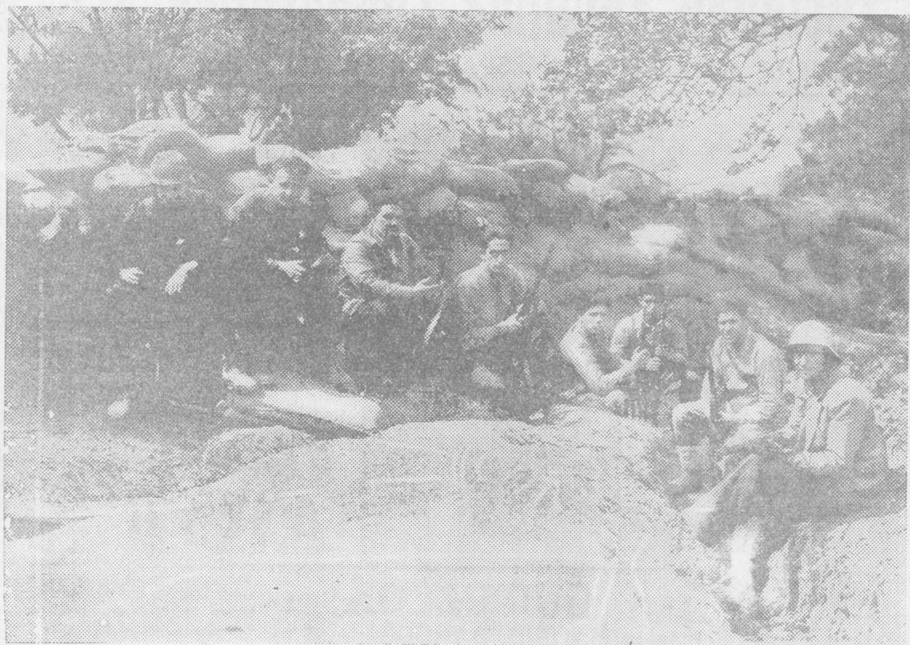
Una avanzadilla de muchachos eibarreses en el sector de Elgueta.

La paz hay que ganarla en la guerra. Nosotros, antimilitaristas, tenemos que atravesar este período de exceso de uniformes. Ellos significan un sacrificio doctrinal para nosotros. A la victoria debemos ofrecerle cuantos sacrificios y rectificaciones doctrinales sean necesarios. Porque ella, con la paz, nos traerá todo lo que forma nuestro ideal completo.—(Diana.)