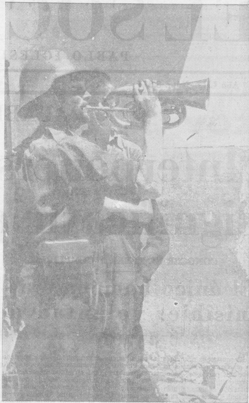
Toque de mando: Preparados para partir al frente.

Acto seguido se señala el orden del día para la próxima sesión, y a las seis y cuarto de la tarde el señor MARTINEZ BARRIO levanta la sesión de hoy.—(Fébus.)