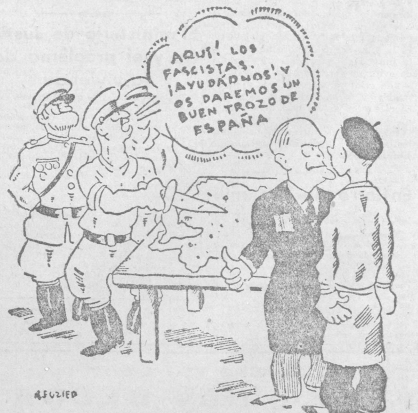
—Este general es un patriota.