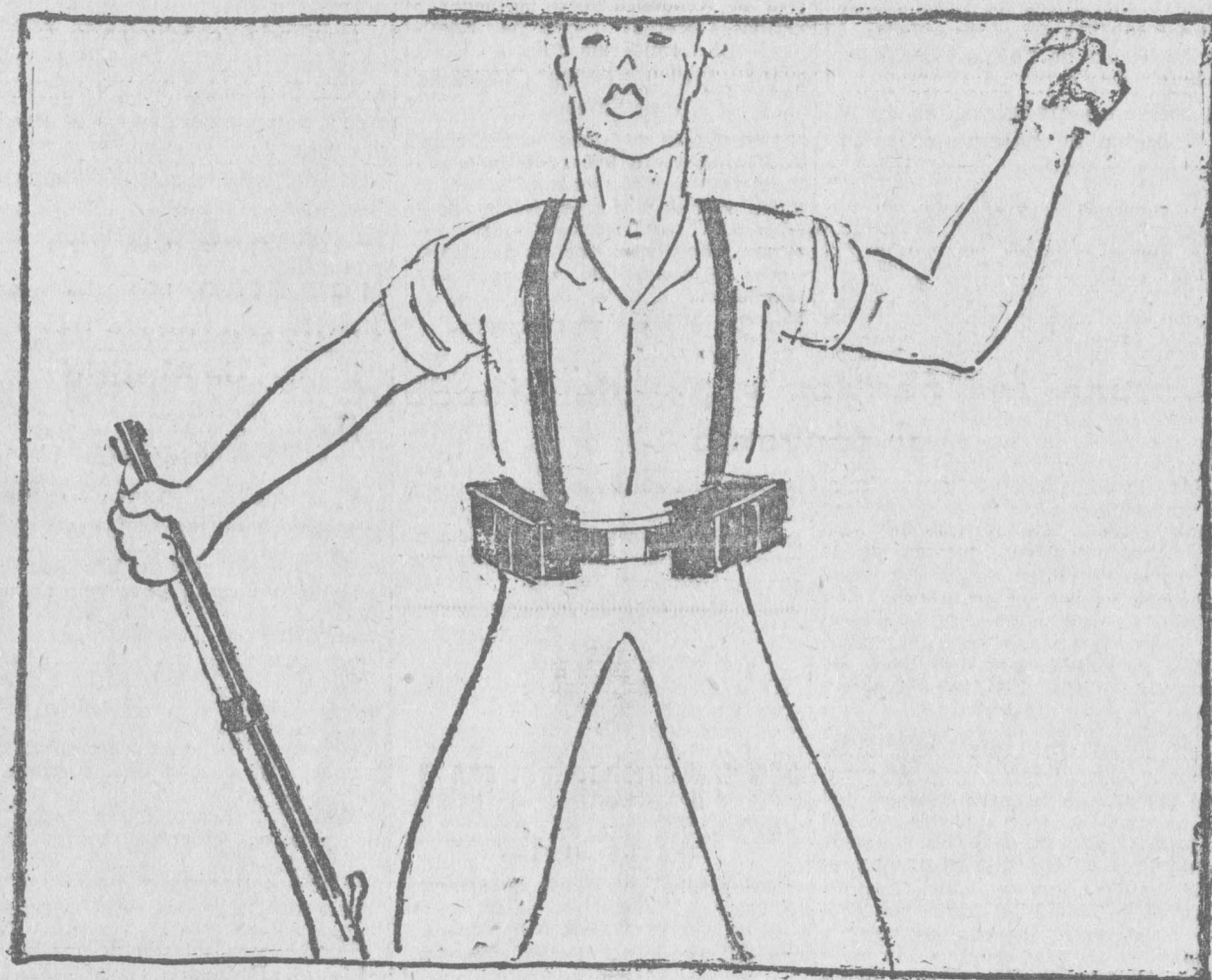
— ¡Vivan las milicias obreras!