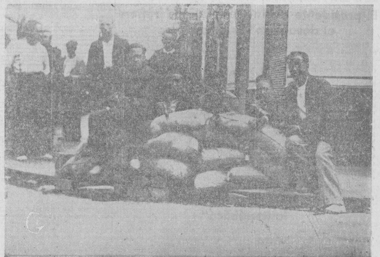
Una ametralladora colocada en una calle y servida por bravos jóvenes de las milicias