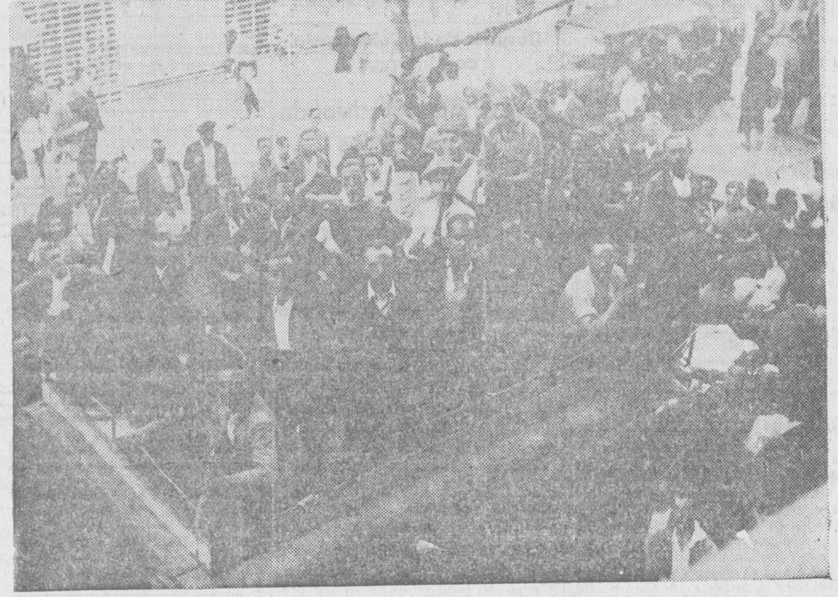
Tomando plaza en un camión de las milicias para salir a las afueras de Madrid