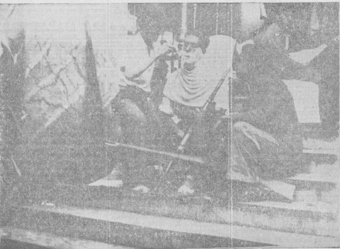
Una vez tomadas por las milicias las Escuelas Salesianas, los jóvenes proceden a asearse

La Administración de EL SOCIALISTA se encarga de servir cuantos libros necesiten sus lectores y suscriptores.