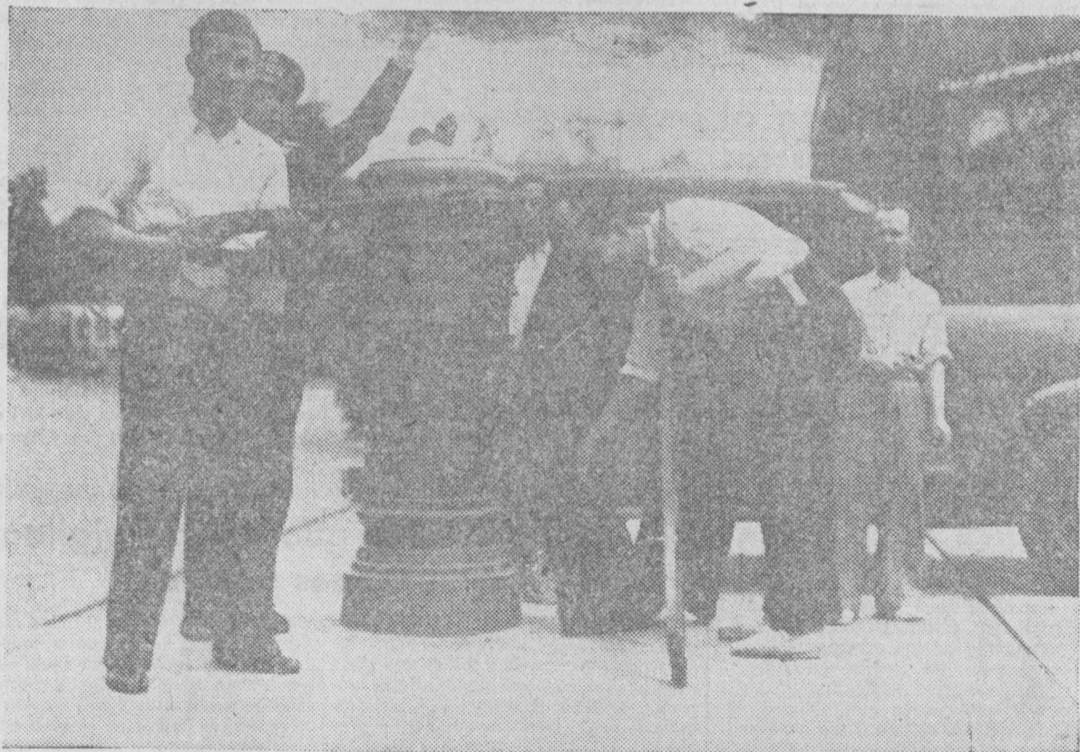
Las milicias ciudadanas atienden también los servicios de Correos, cuando no hay que luchar

¿Columnas sobre Madrid? Quizá lleguemos a conocerlas; pero los soldados que lleguen en ellas vendrán a reforzar las filas de los defensores del régimen, aprovechando la primera coyuntura que se les depare para escapar de las filas rebeldes. Eso es lo que hasta ahora viene sucediendo y lo que con mayor frecuencia sucederá en adelante. Que deserten los soldados al conocer el engaño de que han sido víctimas, es del todo natural; lo que no resulta tan natural es que huyan los oficiales cuando ven el peligro... de Madrid, es decir, cuando dan vista a las tropas leales, a las milicias y a la aviación.