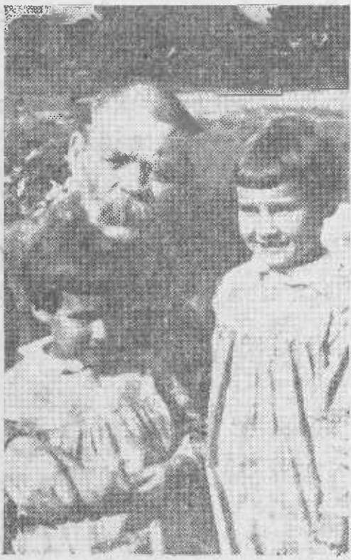
El gran escritor con sus hijos

El primer trabajo de Gorki apareció, en 1892, en una revista de San Petersburgo, y a la hora de adoptar un nombre literario, el escritor adopta el de Gorki (Amargado), que resume todas las horas de su vida. Todo el dolor suyo y el que compartió con quienes tropezó en su paso por los caminos que no conducen a ninguna parte, fue el fondo amargo de su obra. Estos mismos tipos forman el censo de sus protagonistas. La realidad viva de estos personajes, el vigor de las descripciones, sus facultades de observador, le elevaron en poco tiempo a una de las categorías literarias más altas de Rusia. Antes de Gorki se conocía la triste literatura de los mujiks; el descendido aún más, y fue el poeta de los vagabundos de la estepa, cuya existencia no había descrito nadie.