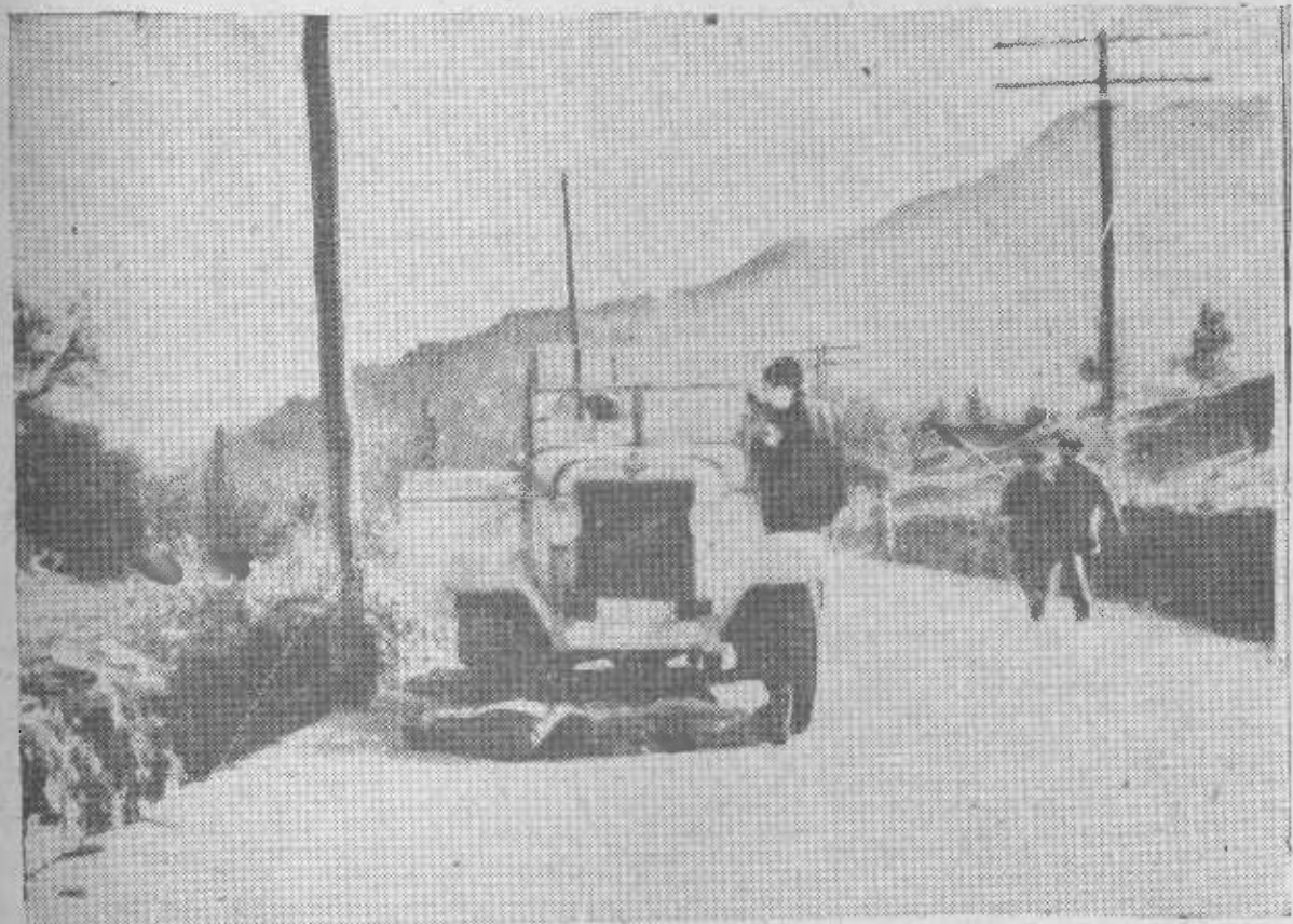
«Héroes de barraca»