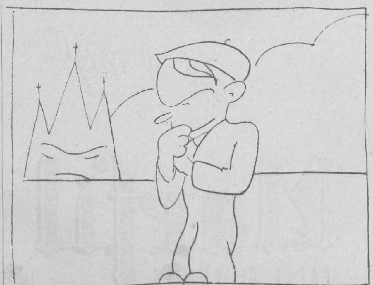
— ¿Será verdad que al tercer día resucitó de entre los muertos? —