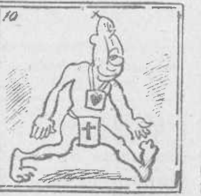
Don Gil no quiere creer que así lo habremos de ver.