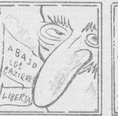
Y un día, ante su nariz, verá la Alcarria feliz.