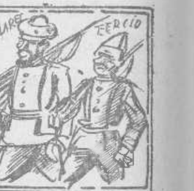
¿Es que acaso usted olvidó lo que a Asturias envió?