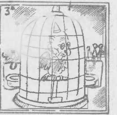
¡Pobre loro presumido, qué triste fin has tenido!