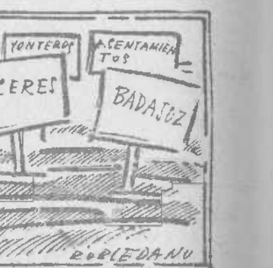
Contento me he de poner si a España así logro ver.