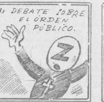
¿Es posible que la Ceda a pedir esto se atreva?