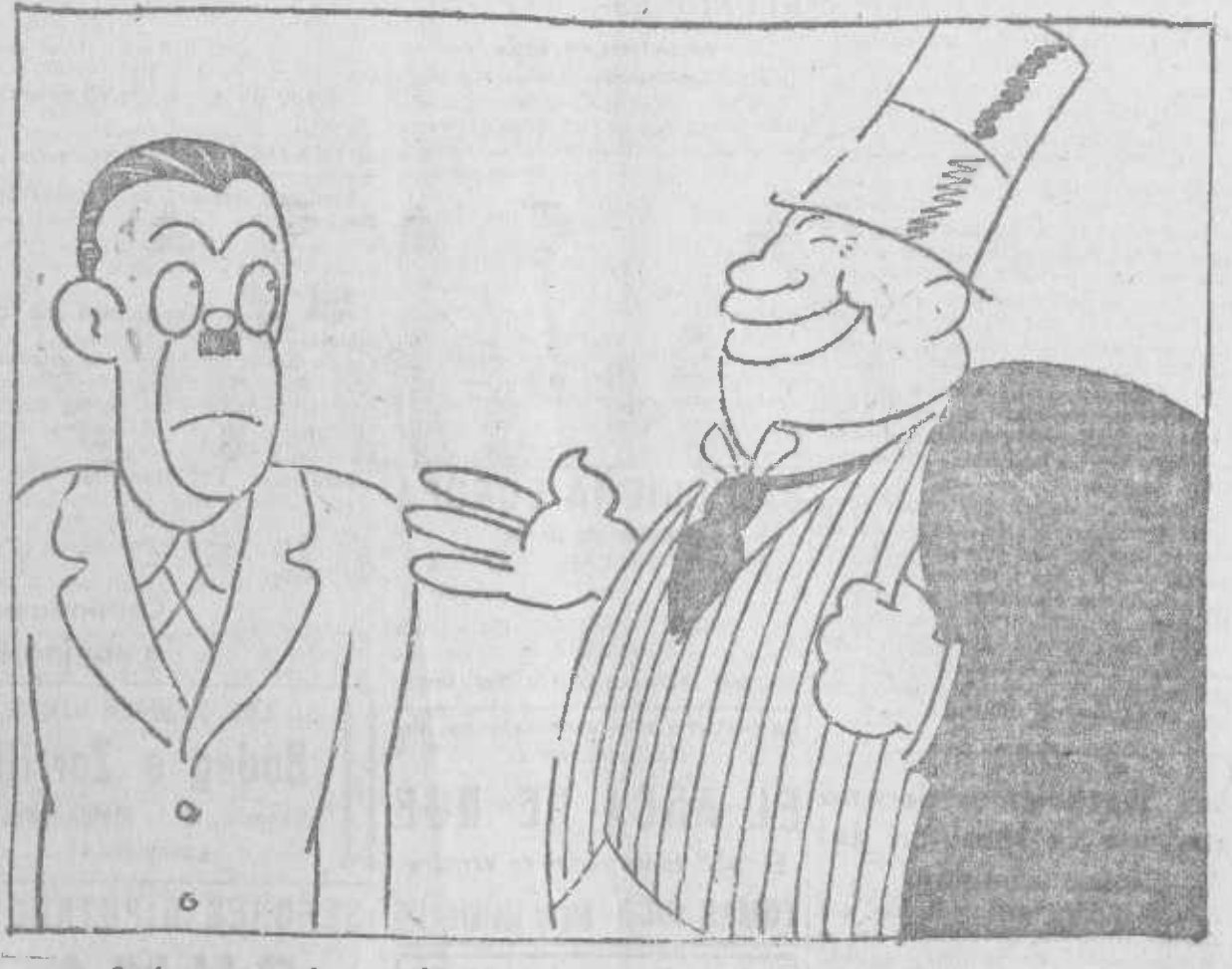
—¿Se ha enterado usted? Maurras condenado en Francia a cuatro años por incitación al asesinato. —No te preocupes; eso es allí. En España hasta nos atrevemos a interpelar al Gobierno.

Trabajadores: Suscribíos a EL SOCIALISTA