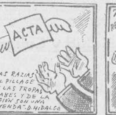
Hidalgo, «notario» era que usted el acta perdiera.