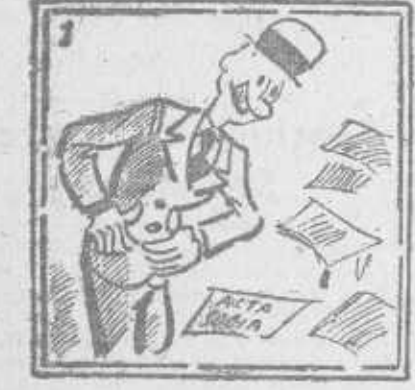
Pero que la estoy gozando; sin acta se van quedando.