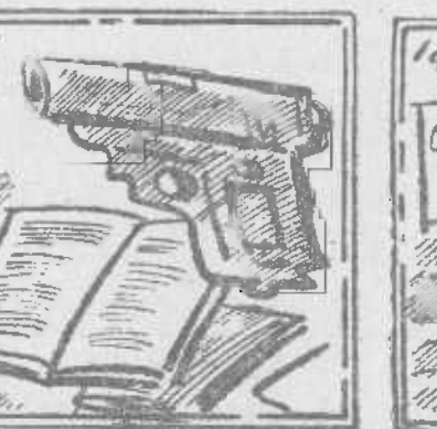
Estudiante, has de estudiar en lugar de disparar.