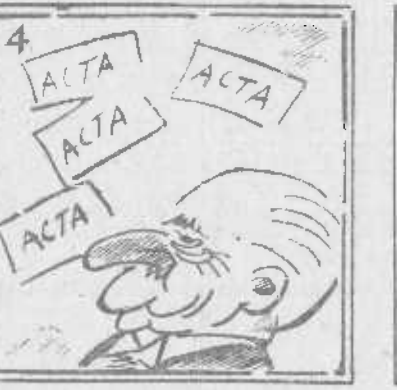
Don Alvaro, el alcarreño, de «sus actas» aún no es dueño.