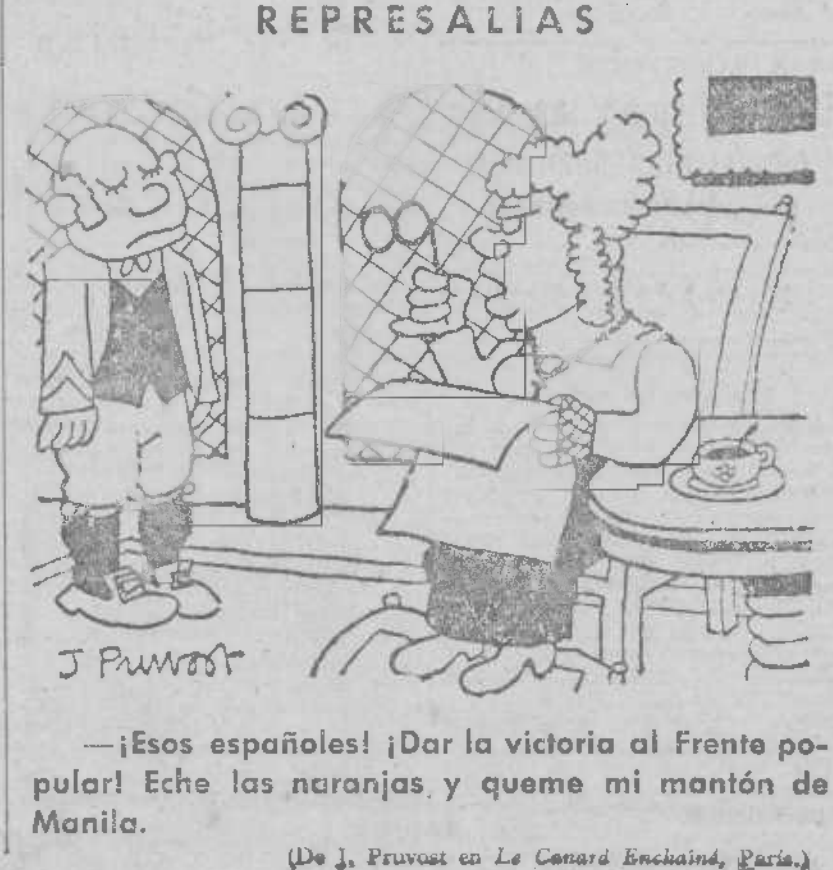
(De J. Pruvost en Le Comrad Enchaîné, París.)