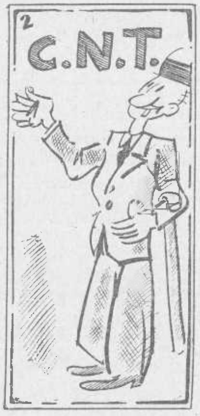
—Aplaudo con emoción a la Confederación.