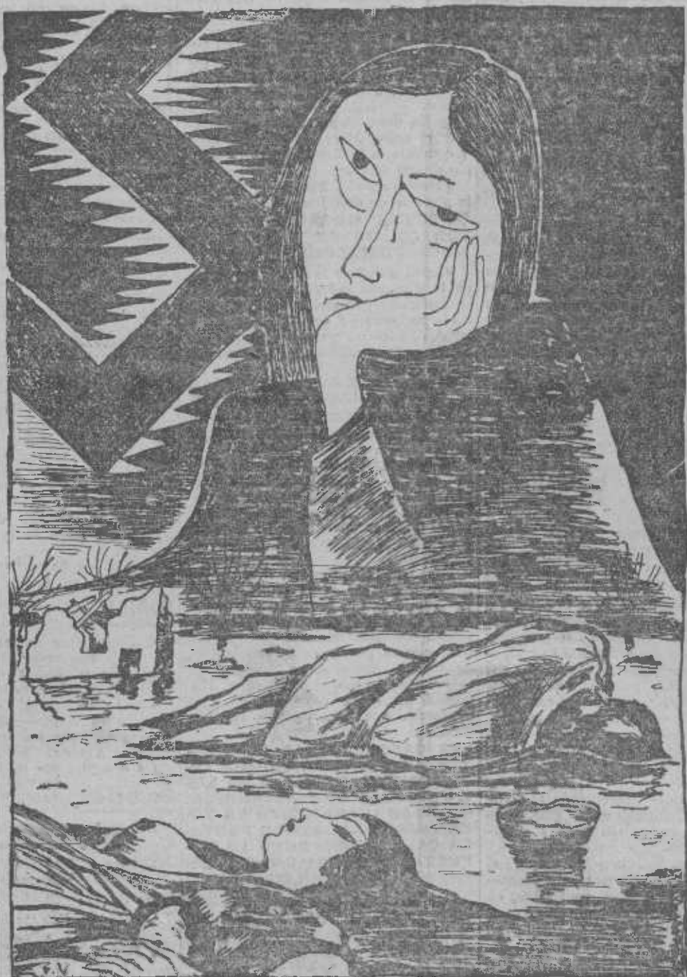
Paisaje fascista... Si las derechas triunfan, ¡la guerra!