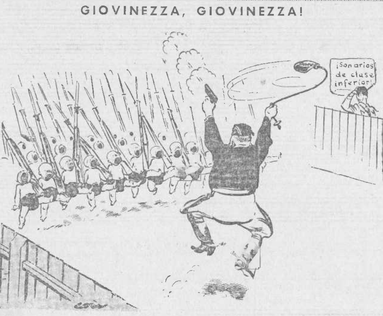
(Mussolini acaba de decretar que el carnet militar será obligatorio para todos los italianos a partir de los once años de edad)