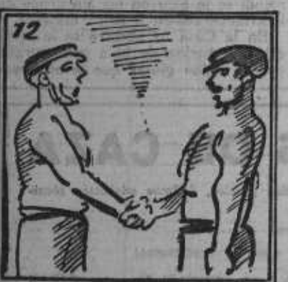
Declaró: ¿Quién tuvo razón: el Gobierno o la opinión?