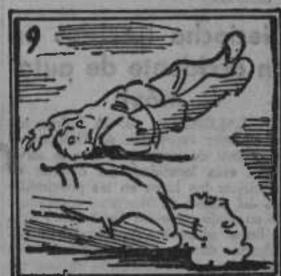
Error del Gobierno fué; creo que claro se ve.