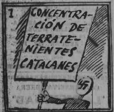
Aquí tenéis la razón origen de la cuestión.