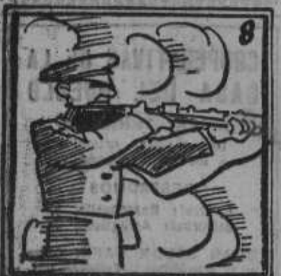
No hubo huelga general, mañana se puede observar.