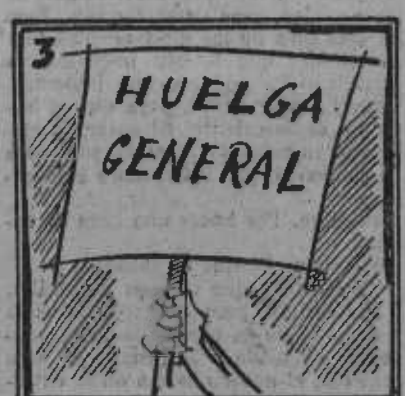
Ante esta provocación, el pueblo da su opinión.