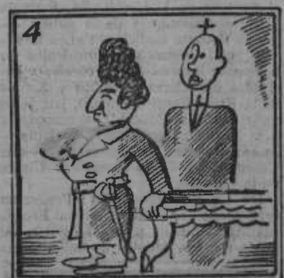
Precavido y justiciero, cierra la Casa al obrero.