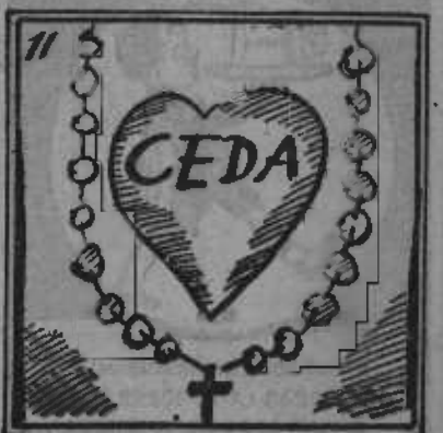
Protesta ve, justa y clara, quien tenga ojos en la cara.