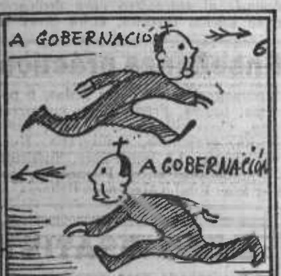
La reunión se celebró, y en ella así se grrtó.