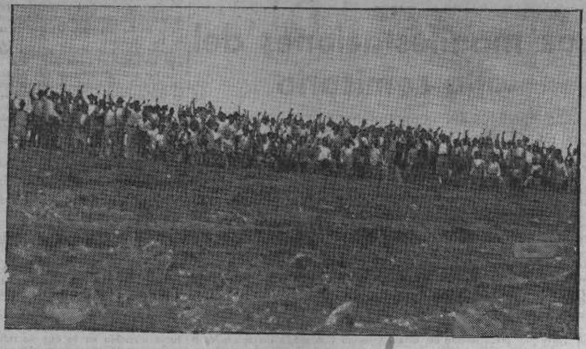
Una marcha de obreros parados organizada por la Sociedad de Obreros de la Tierra (U. G. T.) de la ciudad de Arucas