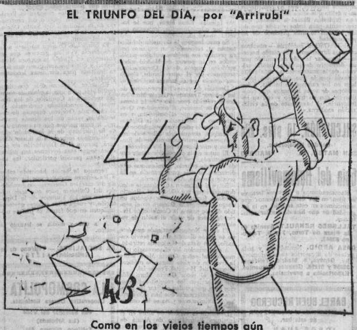
Como en los viejos tiempos aún