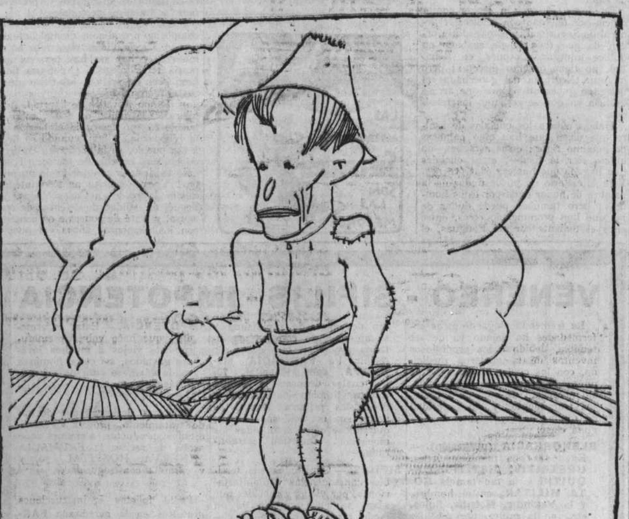
—¡Ustedes, señores ministros, mandarán en la cosecha! Pero en mi hambre... ¡en mi hambre mando yo!