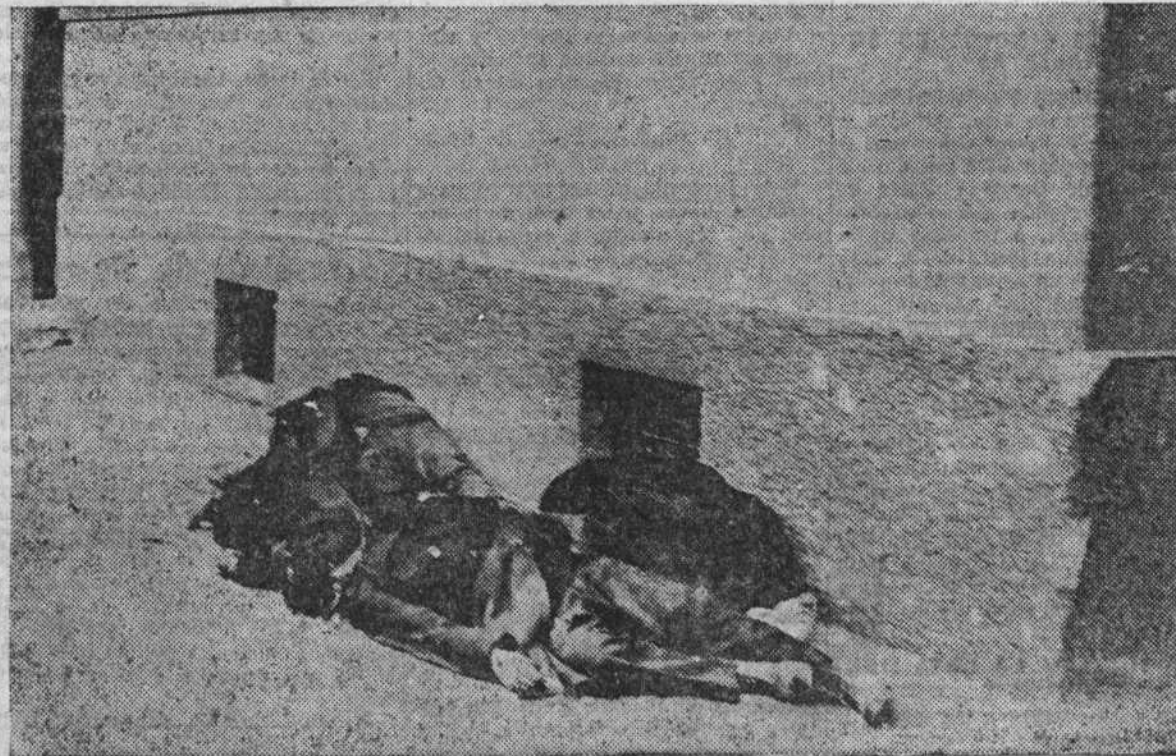
Cuatro tranviarios socialistas muertos en el encuentro de Floridsdorf

VIENA, 20.— Se anuncia que a partir de mañana, a las siete de la mañana, será levantado el estado de sitio en toda Austria.—(United Press.)