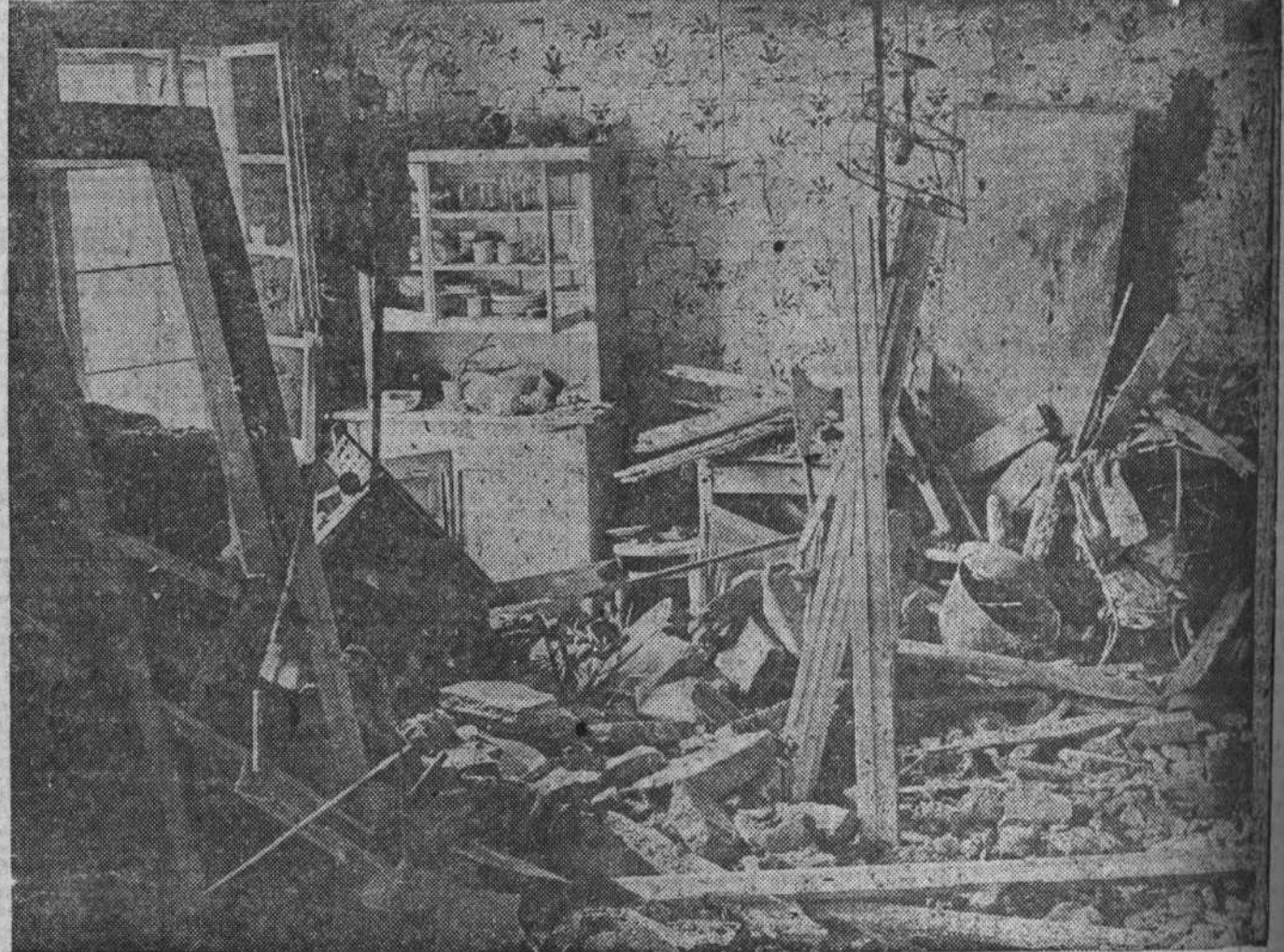
El comedor de una casa obrera después del bombardeo