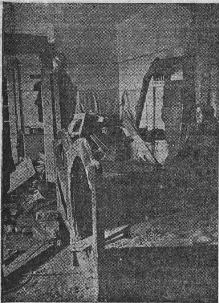
Una mujer obrera contemplando impávida, a pesar de su luto, los destrozos de la artillería católica de Dollfuss