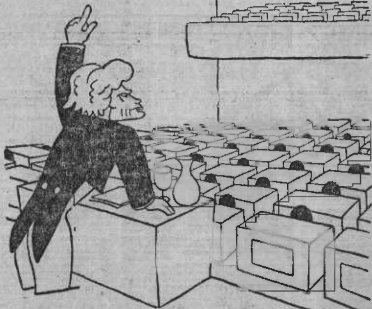
Paul Boncour intenta convencer a sus oyentes de la necesidad de asegurar la paz por el desarme.

en grupos armados de gaites, ofreciendo a cerrar no sólo a los emigrados israelitas, sino también a los cristianos. Un almacén fue asaltado y saqueado.