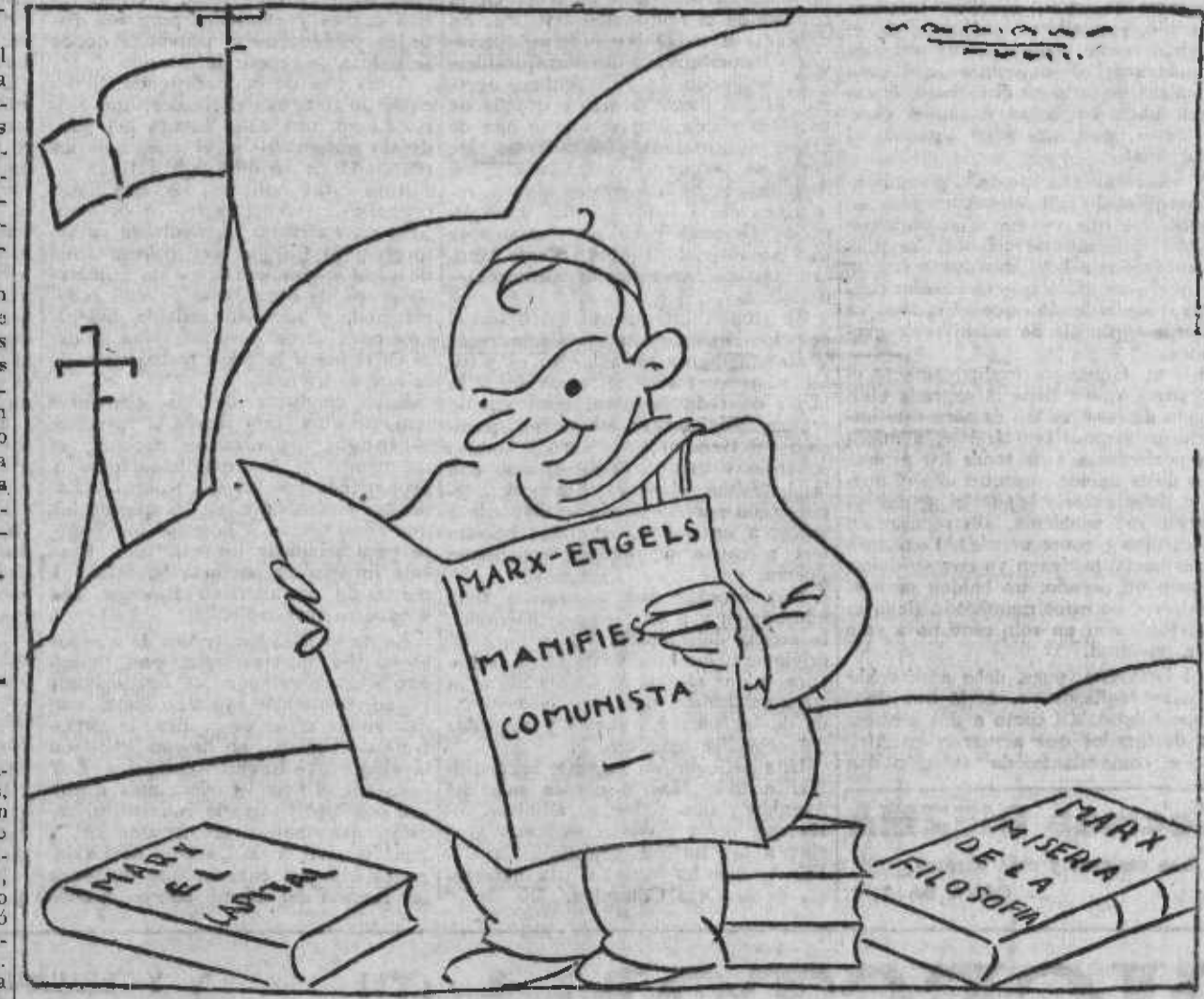
¡Nada, por más que leo, no encuentro nada que se refiera al 40 por 100.

El señor Jaén pertenece al partido radical socialista independiente.—(Diana.)