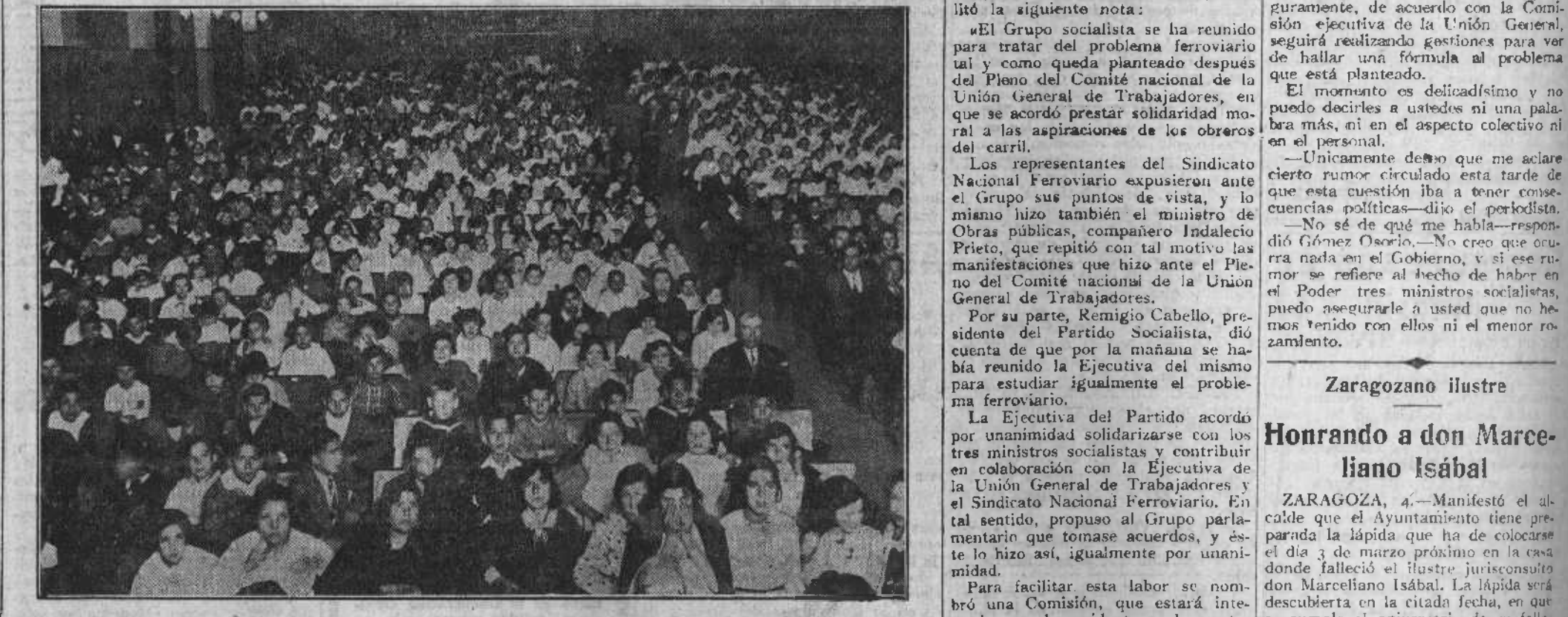
Fiesta escolar organizada por la Agrupación Socialista de dicha localidad

Para facilitar esta labor se nombró una Comisión, que estará integrada por el presidente y el secretario de la Ejecutiva del Partido; presidente y secretario de la Ejecutiva