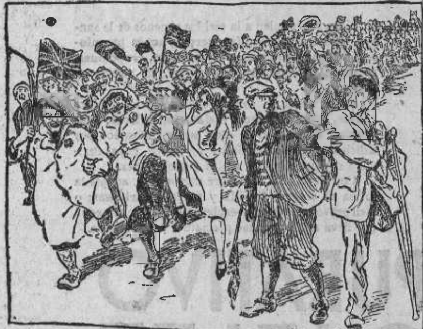
El joven nacionalista al mutilado: ¡Quítate de en medio! Paso al cortejo conmemorativo!

Se admiten suscripciones a EL SOCIALISTA a 2,50 pesetas en Madrid y a 3 pesetas en provincias.