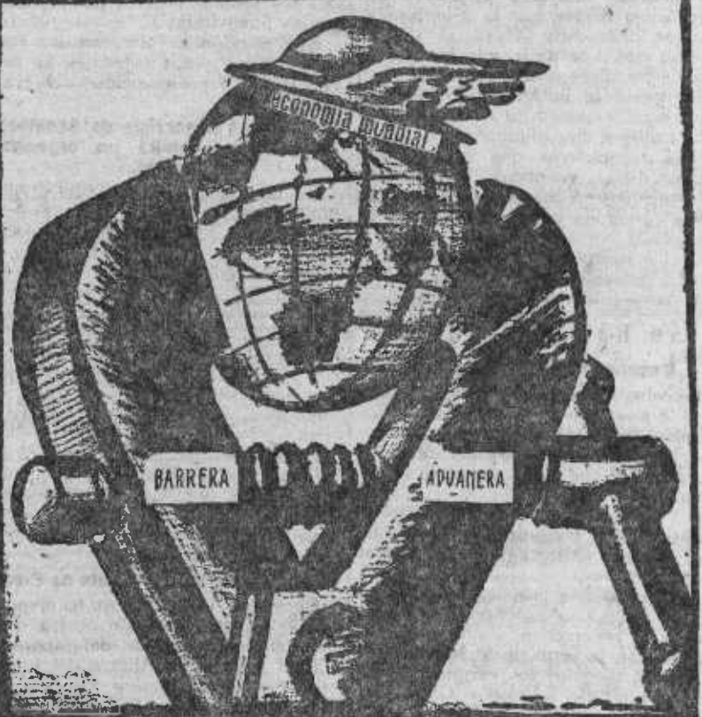
El torneo de las barreras arancelarias (De Il Popolo d'Italia, Milán.)