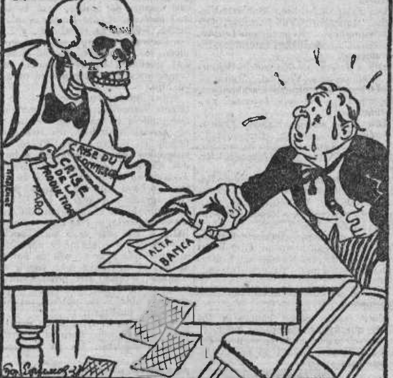
LA MUERTE.—¡COP!