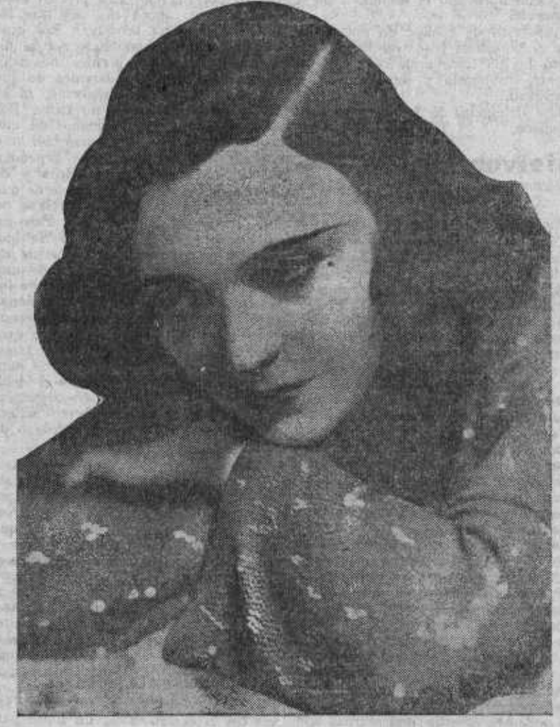
¿Qué intrínseca la palidez de este rostro de Pola Negri en el bello marco de sus cabellos negros?