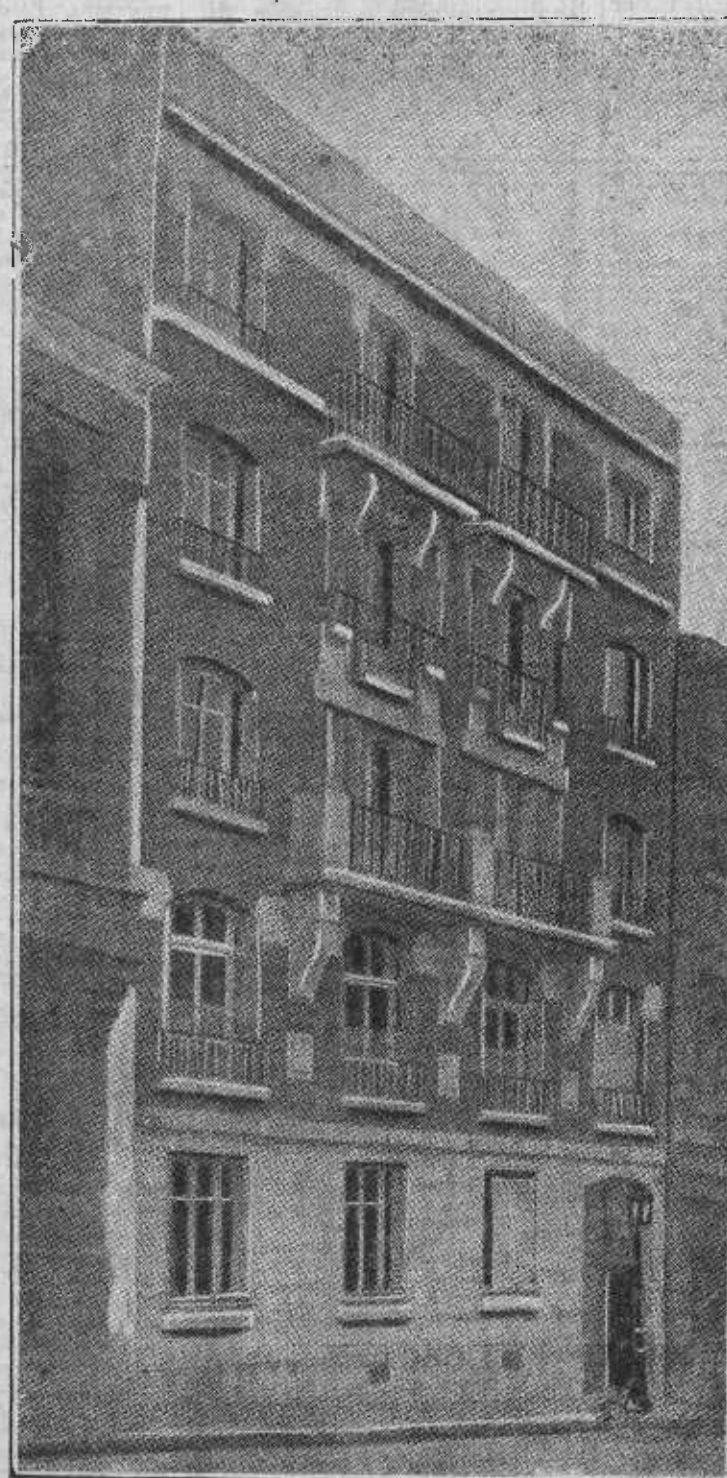
Casa donde se hallan instaladas, en París, calle de Jules Brétón, 7, las oficinas de la Federación francesa de los Trabajadores del Libro, cuyo cincuentenario acaba de celebrarse.

No queremos una Constitución castiza. Por necesidad tiene que tener influencias de fuera. ¡Claro! De donde antes que aquí se renovó el ambiente. ¿Una Constitución! Si es el orden nuevo de la casa. En el viejo, con las ventanas cerradas, se nos vició la atmósfera. Lo menos que podemos pedir es que se abran de par en par, para que salga precisamente el casticismo de la maza en el poder, el jesuita en la intriga y el caciquismo tirando de los hilos. Y que entre aire de fuera. ¿Pues de dónde va a entrar el aire libre?