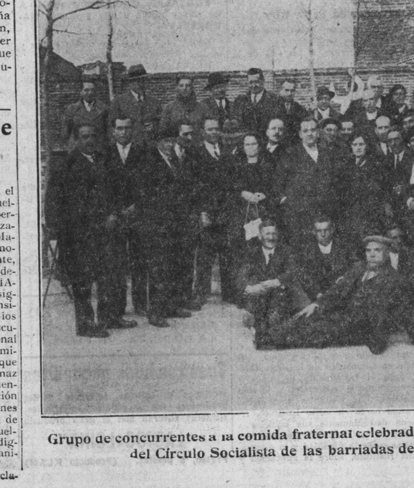
Grupo de concurrentes a la comida fraternal celebrada con motivo de la inauguración del Círculo Socialista de las barriadas del Puente de Segovia

A LAS SECCIONES Estimados compañeros: Desde el día 19 de enero se encuentran en huelga 5.000 confederados nuestros pertenecientes a las distintas organizaciones de las Artes Gráficas de Madrid. Las causas origen de este movimiento las conocéis, seguramente, por haber sido expuestas con todo detalle en las columnas de EL SOCIALISTA. No obstante, queremos significaros que a la actitud de transigencia en que se han colocado los representantes obreros en las discusiones con la representación patronal ha contestado esta última en términos tales, que obligan a suponer que sólo a base de una resistencia tenaz por parte de los huelguistas, cimentada en la más patente demostración de solidaridad de todas las Secciones pertenecientes a la Unión General de Trabajadores, es posible que la huelga termine con la solución que dignamente puedan aceptar las organizaciones gráficas madrileñas. El plan de intransigencia de la