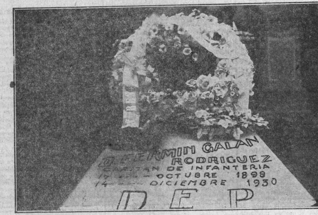
Tumba del capitán Galán en el Cementerio Civil de Huesca, con la corona enviada por los presos políticos de Jaca