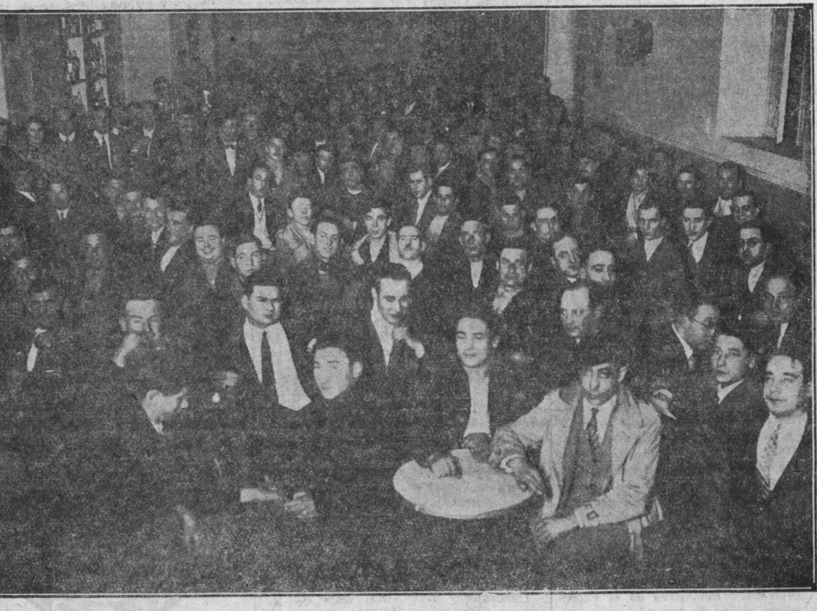
Concurrentes al acto conmemorativo del aniversario de la República en Jaca