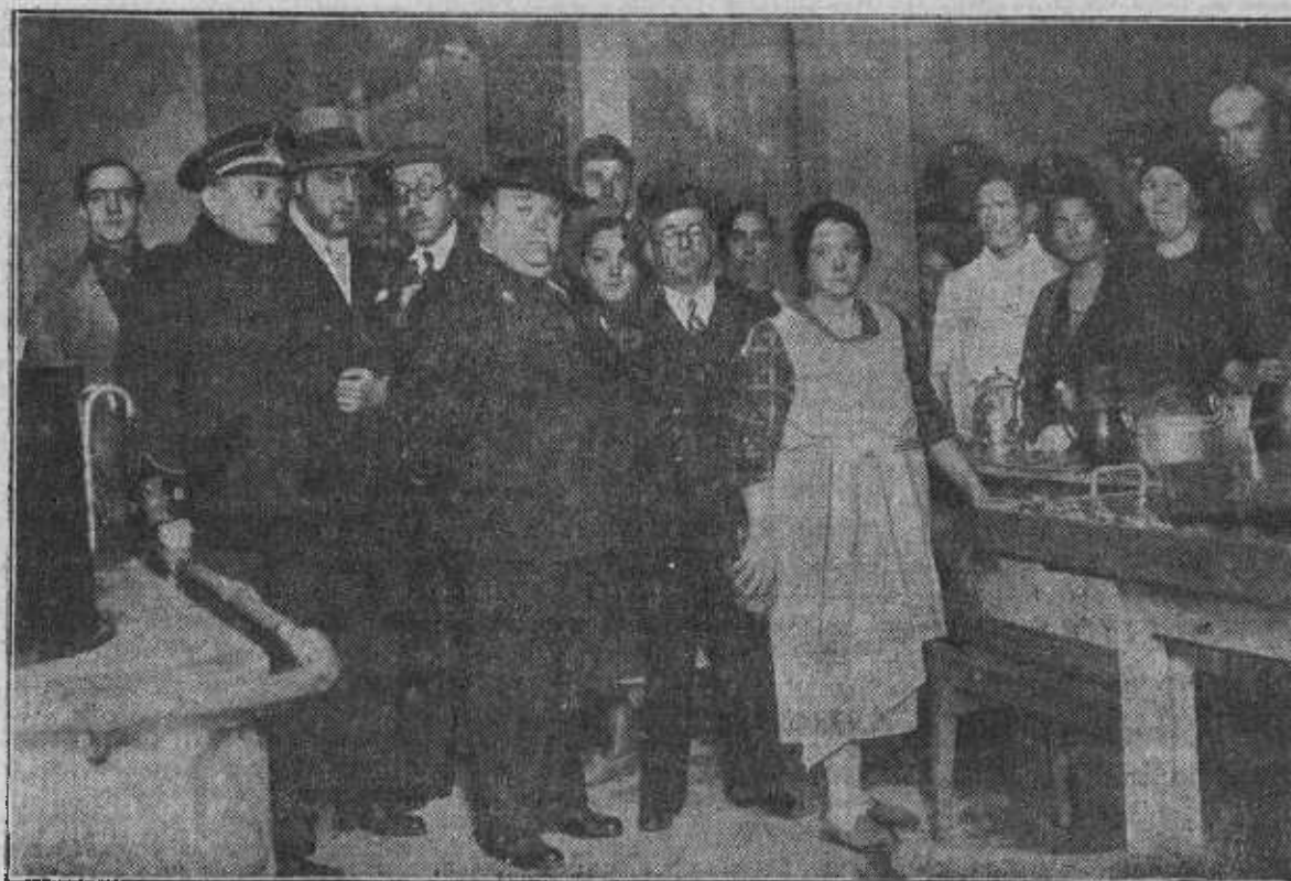
El alcalde y otras autoridades municipales en la inauguración de los Comedores sociales de la calle de Santa Engracia