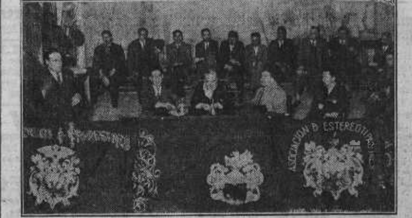
Presidencia del acto conmemorativo del aniversario del Arte de Imprimir y de la Federación Gráfica Española, celebrado en la Casa del Pueblo

La primera solución instintiva a las ansias de felicidad humana es el conformismo. Viene después, en este orden de ideas, la segunda solución, predicada por la Iglesia, y que des-