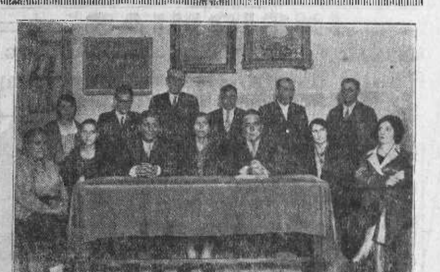
La presidencia y varios delegados de los que asisten al Congreso de Cerilleros.

SAN SEBASTIAN, 26.—Esta madrugada, dos capitanes, uno de artillería y otro de caballería, comenzaron a dar gritos de viva el rey y muera la República. Los desaprovechos militares fueron detenidos y multados por el gobernador con 500 pesetas.