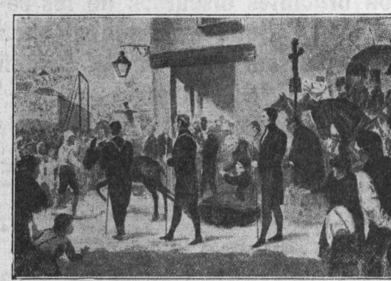
"Ejecución del general Riego" (cuadro de Pablo Bójar). Del libro de Carmen de Burgos (Colombine).

Pero el terrible Pérez fracasa en su intento de hacerle al Padre Eterno que extermine a Lucifer y con él a todas las desventuras que arrojó sobre la Humanidad. El Padre Eterno se achica y reconoce que no es él el ser supremo, y que más arriba de los cielos es probable que esté el que conoce el secreto del bien y del mal.