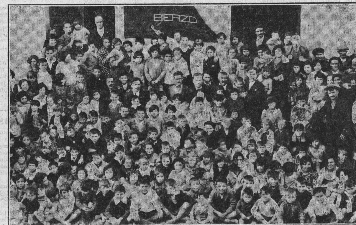
Grupo de concurrentes a la fiesta infantil celebrada en la Casa del Pueblo de Ponferrada

En esta importante reunión habrán varios compañeros de la Comisión de huelga para dar cuenta del desarrollo y situación del conflicto.