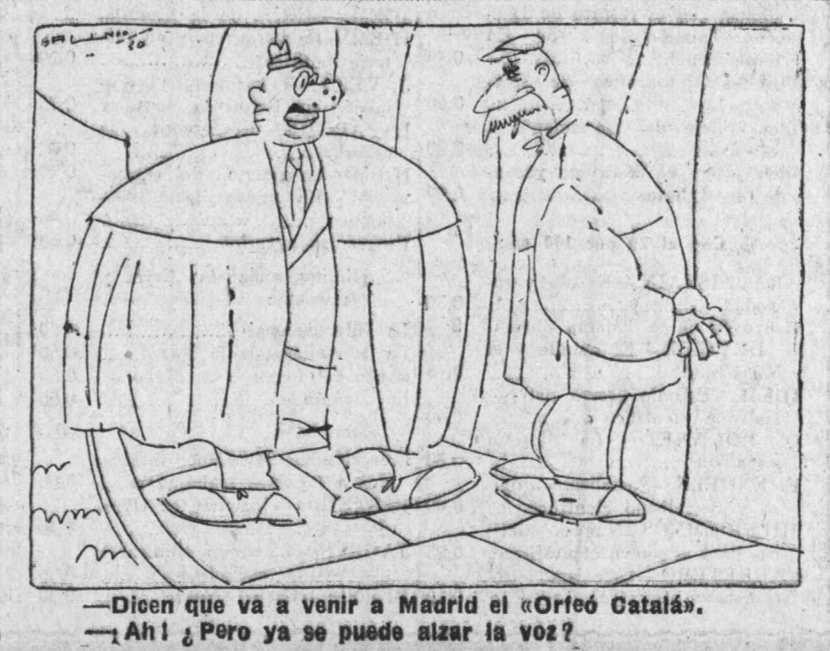
—Díen que va a venir a Madrid el «Orléo Catalá». —Ahí! ¿Por qué se puede alzar la voz?