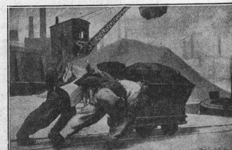
«Mineros», cuadro de Gautier