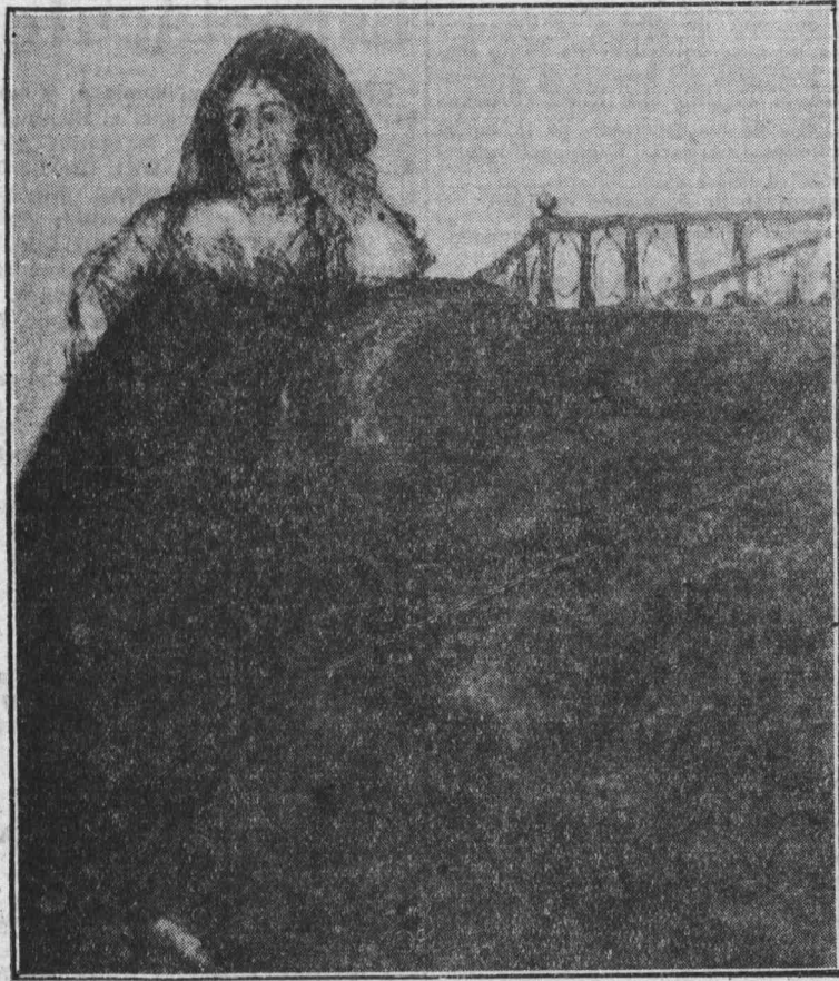
«Manola», una de las famosas pinturas negras de Goya.

pre, la reflejara allí donde él presumió que acabarían sus días. Si no correspondió; si, coqueta, jugó con el corazón de Goya, y éste sólo fue una víctima más de las coquetuerías de la duquesa, no es menos lógico que siempre pensase en ella, que muchos años después de muerta la pintase en una de las paredes que le rodeaban, porque ese proceder, esos juegos a que se entregan las coquetas desesperadas a los que las aman, arman a veces de los homicidas; pero es precisamente porque las pasiones que con sus peligrosos juegos mantienen, se acrecientan, envolviendo los espíritus