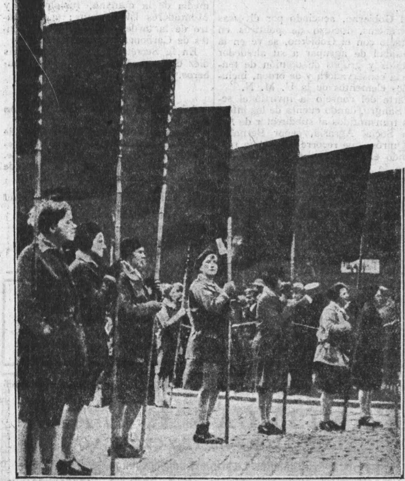
Mujeres alemanas. Banderas rojas. ¡Socialismo! He aquí un alto ejemplo que nuestras mujeres deberan imitar.