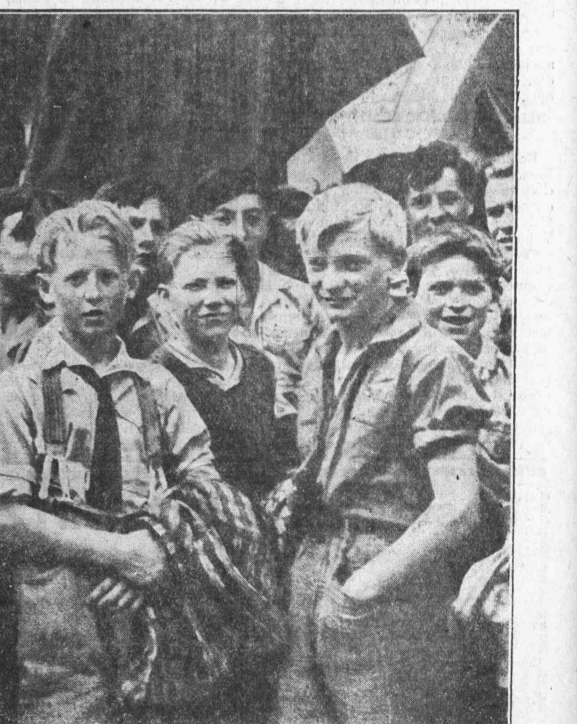
Todavía no son jóvenes: son adolescentes. Pero ya son socialistas estos muchachos rubios del país de Marx.

Por la importancia y significación del acto es de suponer que ni un solo obrero de las Artes Gráficas dejará de asistir.