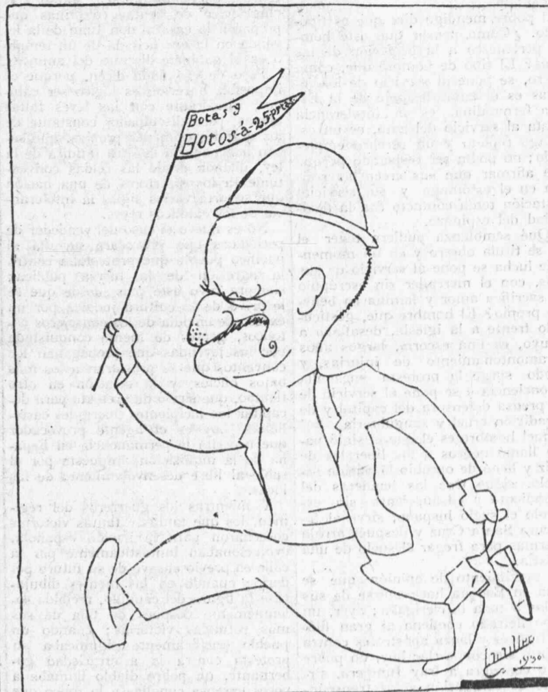
La bandera de paz de Romanones