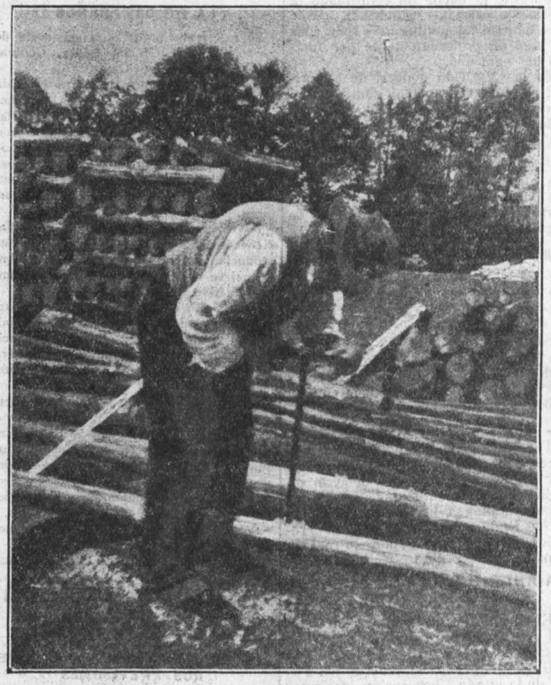
El anciano gira la barrena sobre el tronco. Trabajar, trabajar siempre en el régimen capitalista. Cuando se es niño, cuando se es viejo.

PLASENCIA, 22.—Desde esta ciudad se ha trasladado a Cáceres una numerosísima Comisión, en representación de todas las clases sociales, para protestar ante el gobernador contra la política indigna que se sigue por los elementos de la dictadura en este Ayuntamiento, que se han readaptado al régimen actual para continuar ejerciendo su funesto predominio.