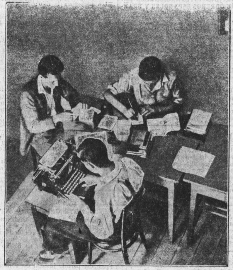
Así trabajan los jóvenes socialistas de Austria. Una máquina de escribir, un fichero, carnets... Labor silenciosa y tenaz, persistente, por el Socialismo.

—La reacción avanzaba en 1923 —me contestó—. Los primeros batallones fascistas, creados en 1920, manifestaban una actividad creciente. Ya los fascistas habían derramado sangre obrera. Sólo en