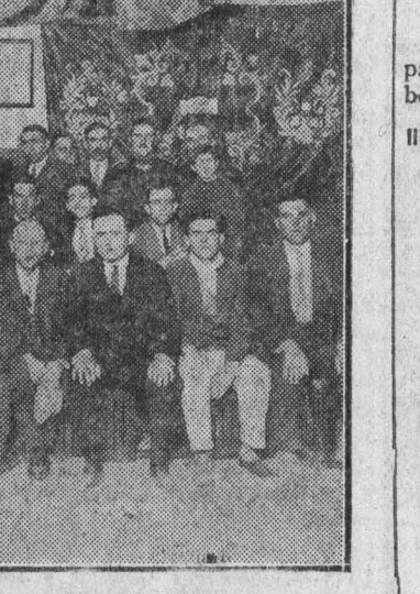
Delegados y Comisión ejecutiva de la Federación del Arte Rodado que intervienen en el Congreso de Obreros del Transporte.

Para que la acción integral del movimiento socialista—Sindicatos, Cooperativas, Mutualidades, Grupos juveniles y artísticos—alcance la debida resonancia, necesitamos que EL SOCIALISTA tenga cada día un número más importante de lectores, sea su información más completa y el cuadro de colaboradores más escogido. Ayudados, camaradas, en este empeño promoviendo en todas partes donativos y suscripciones para EL SOCIALISTA, adquiriéndolo vosotros y procurando que lo lean vuestros camaradas y amigos.