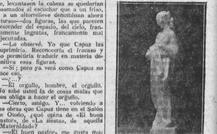
«La Abundancia», de Juan de Adsuara, que es una de las obras más bellas que figuran en el Salón de Otoño.

dísima y su ritmo muy sugestivo. Todo ideado con ese gran sentido de lo decorativo que tiene Capuz.