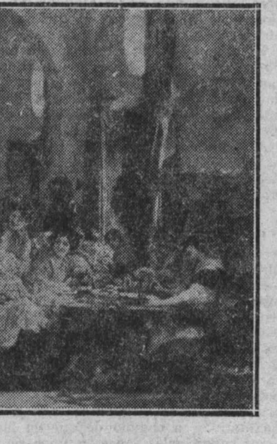
"Las cigarreras", de Gonzalo Bilbao