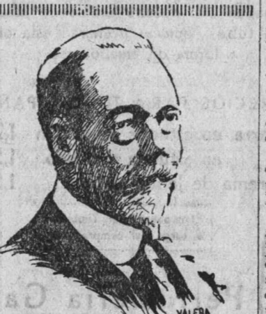
Jorge V, rey de Inglaterra, que está enfermo hace días.

Es mucha la carestía de la vida, agravada por la gran crisis de trabajo y de jornales mezquinos en relación con aquella carestía, para que se autorice una subida en un artículo que ya resulta de lujo para muchas familias, entre las que se cuentan, claro está, las que acaso necesitan más nutrición por su mayor desgaste físico en los más rudos trabajos.