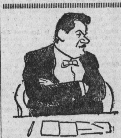
Eduardo Herriot, presidente del partido radical-socialista francés.

Los trabajos del Congreso se discutirán en las respectivas Ponencias para formular las conclusiones que discutirá la asamblea plenaria.