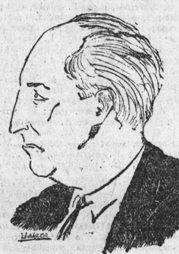
Francisco Largo Caballero, que dió anoche una magnífica conferencia en la Casa del Pueblo sobre los Comités paritarios, y cuyo texto íntegro publicará EL SOCIALISTA el martes próximo.

Trabajadores! Propagad y leed vuestro diario EL SOCIALISTA