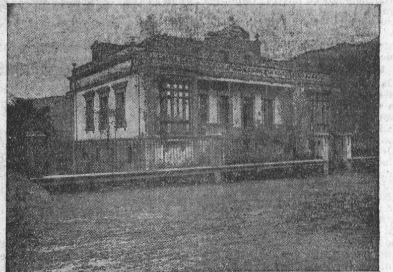
Fachada principal de la Casa del Pueblo de Labiana, adquirida por el Sindicato Minero hace cuatro meses.—Mide 18 metros de línea por 12 de fondo, con una extensión de terreno de 6.400 metros cuadrados.

Casa bella, amplia, con jardín y arbolado, con todo lo que ambicionamos los socialistas para recreo del espíritu humano. El mundo con que soñamos los socialistas para la Humanidad, para toda la Humanidad, ha de reunir todas las condiciones de comodidad física y de